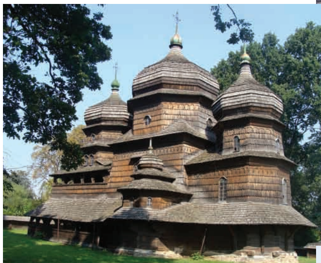
Дрогобич (Львівська область) Церква Св. Юра, збудована у другій пол. XVII ст. Новіший варіант галицького типу. Стіни нави, бабинця й емпори вкриті розписами XVII ст. Зберігся іконостас XVII ст.