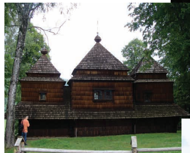
Туринсько (Turzańsk, Підкарпатське воєводство) Церква Св. арх. Михайла, збудована у 1801-1803 роках. Східно-лемківський тип. Зберігся іконостас кін. XIX ст.