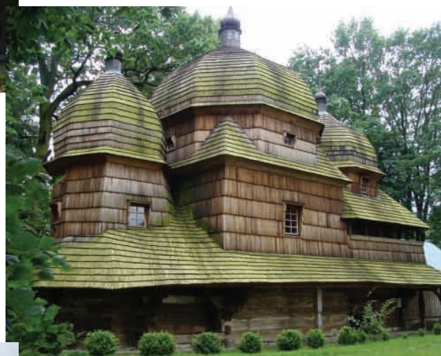
Хотинець (Chotyniec, Підкарпатське воєводство) Церква Різдва Пр. Богородиці, збудована 1731 року. Новіший варіант галицького типу. Зберігся стінопис 1735 року та іконостас XVII ст.