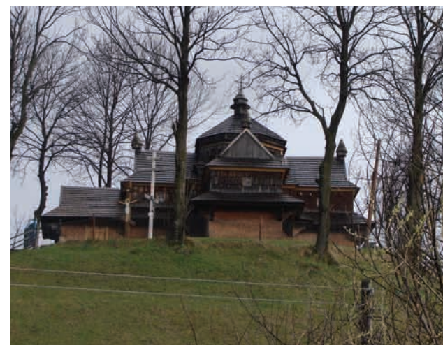
Нижній Вербіж (Івано-Франківська область, Коломийський район) Церква Різдва Пр. Богородиці, збудована 1808 року. Гуцульський тип. Зберігся іконостас початку XIX ст.