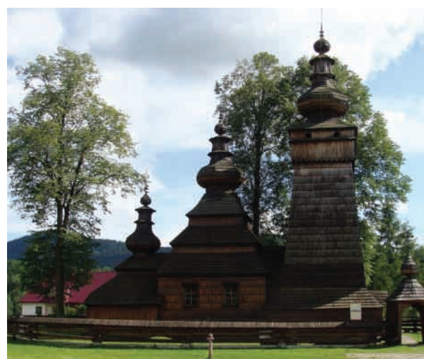
Кятонь (Kwiaton, Малополюське воєводство) Церква Св. Параскеви, збудована 1811 року. Західно-лемківський тип. Зберігся іконостас кін. XIX ст.