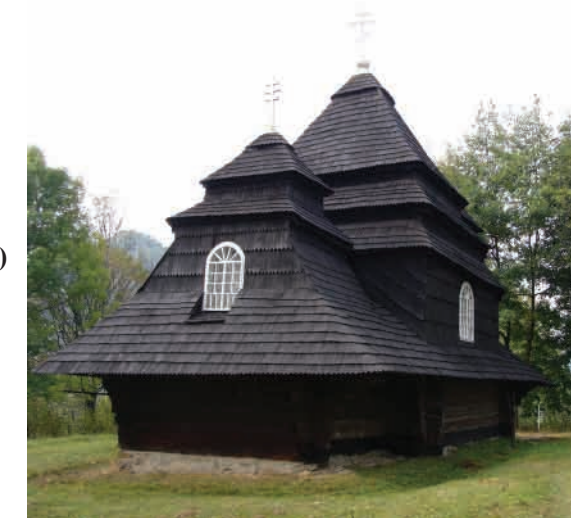
Ужок (Закарпатська область, Великоберезнянський район) Церква Св. арх. Михайла, збудована 1745 року. Бойківський тип. Зберігся іконостас початку XVIII ст.

Автор усіх світлин та текстівок – Василь Слободян (kraeznavstvo@ukr.net)