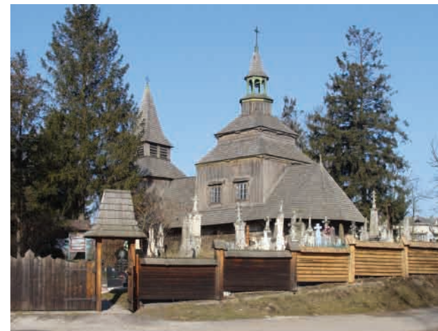
Рогатин (Івано-Франківська область) Церква Зішестя Св. Духа, збудована на початку XVI ст. Давній галицький тип. Зберігся іконостас 1650 року.

Автор усіх світлин та текстівок – Василь Слободян (kraeznavstvo@ukr.net)