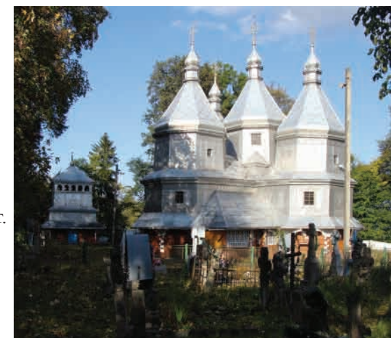
Ясиня (Закарпатська область, Рахівський район) Церква Вознесення Господнього, збудована 1824 року. Гуцульський тип. Зберігся іконостас поч. XIX ст.