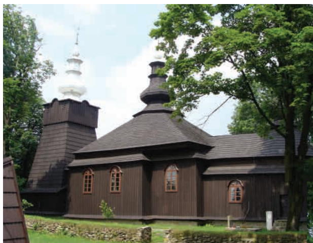
Брунари Вижні (Bruhari Wyzne, Малополюське воєводство) Церква Св. арх. Михайла, збудована 1830 року. Західно-лемківський тип. Зберігся іконостас поч. XIX ст.