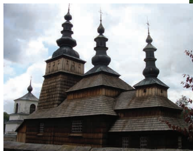
Рихвалд (Owczary, Малополюське воєводство) Церква Покрови Пр. Богородиці, збудована 1653 року. Західно-лемківський тип. Зберігся іконостас поч. XVII ст.