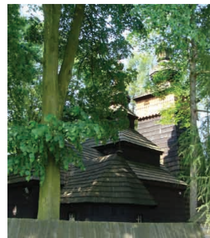
Радруж (Radruż, Підкарпатське воєводство) Церква Св. Параскеви, збудована 1583 року. Давній галицький тип. Зберігся стінопис XVII-XVIII ст.