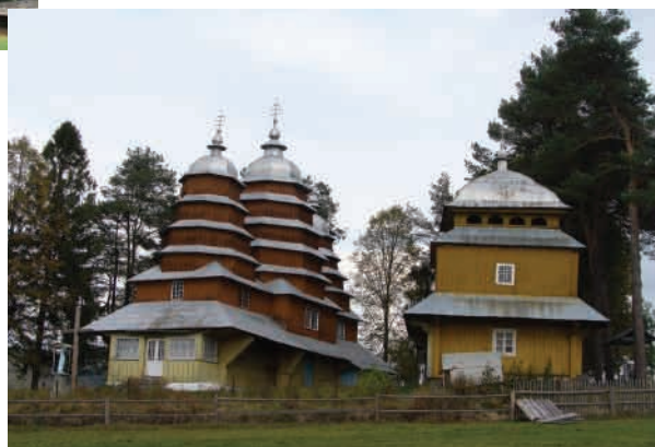
Матків (Львівська область, Турківський район) Церква Св. Дмитра (Собору Пр. Богородиці), збудована 1838 року. Бойківський тип. Зберігся іконостас поч. XIX ст.