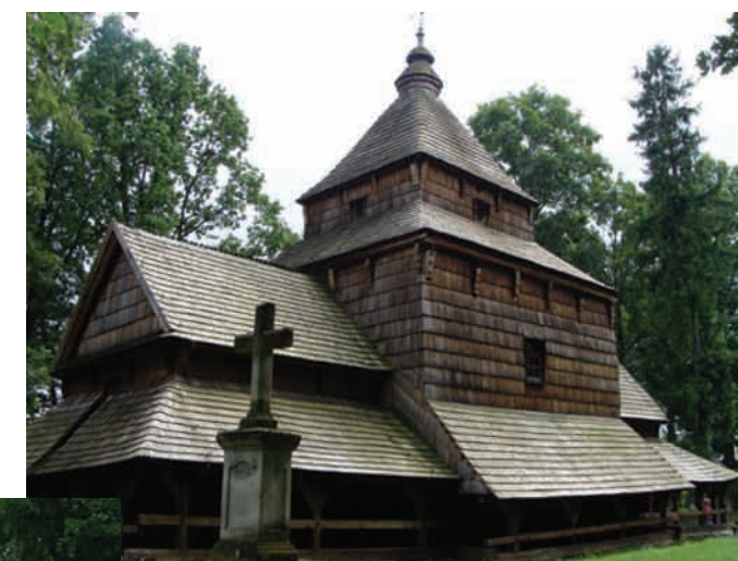
Смільник (Smolnik, Підкарпатське воєводство) Церква Св. арх. Михайла, збудована 1791 року. Бойківський тип