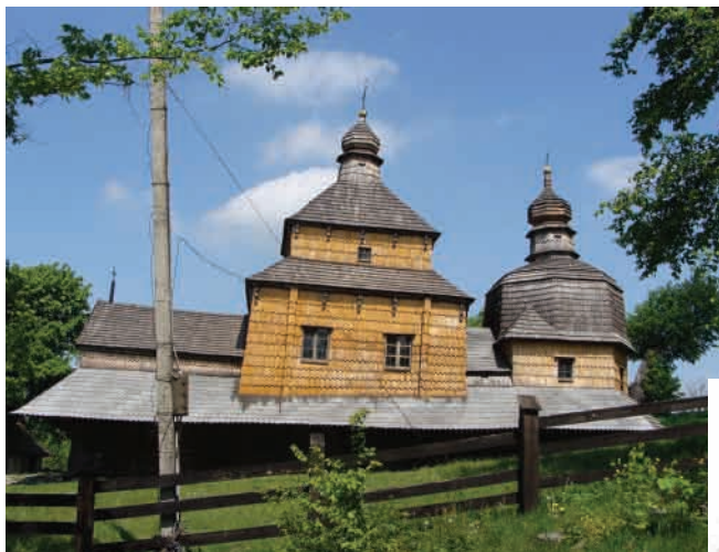
Потелич (Львівська область, Жовківський район) Церква Зішестя Св. Духа, збудована 1502 року, перебудована 1718 року. Давній галицький тип. Зберігся стінопис 1628 року.