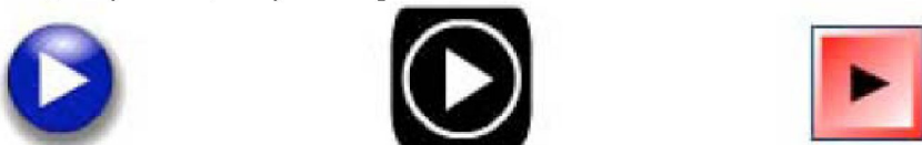
Рис. 1 – Возможные варианты кнопок программы "Sonic Memo"

Звуковые файлы в формате mp3 (можно взять фрагменты классических музыкальных произведений, ассоциированных с темой книги, или записанные в звуковом формате комментарии автора) размещают в отдельной под-директории (назовите её, например, mp3files). Также необходимо создать папку (традиционное имя smplayers ) и поместить в неё программу-проигрыватель с расширением swf, разные варианты которой предоставляются коммерческой программой SonicMemo [14]. Дальнейшее выполняется в названной программе SonicMemo: можно выбрать один из трёх типов кнопок (рис. 1) и их количество (1, 3 или 5). После этого программа генерирует html-код, который можно включить в страницы электронного учебника. Теперь при просмотре созданного html-файла Интернет-браузером будут видны «музыкальные кнопки» (в виде, например, рис. 2), запускающие звуковые файлы.