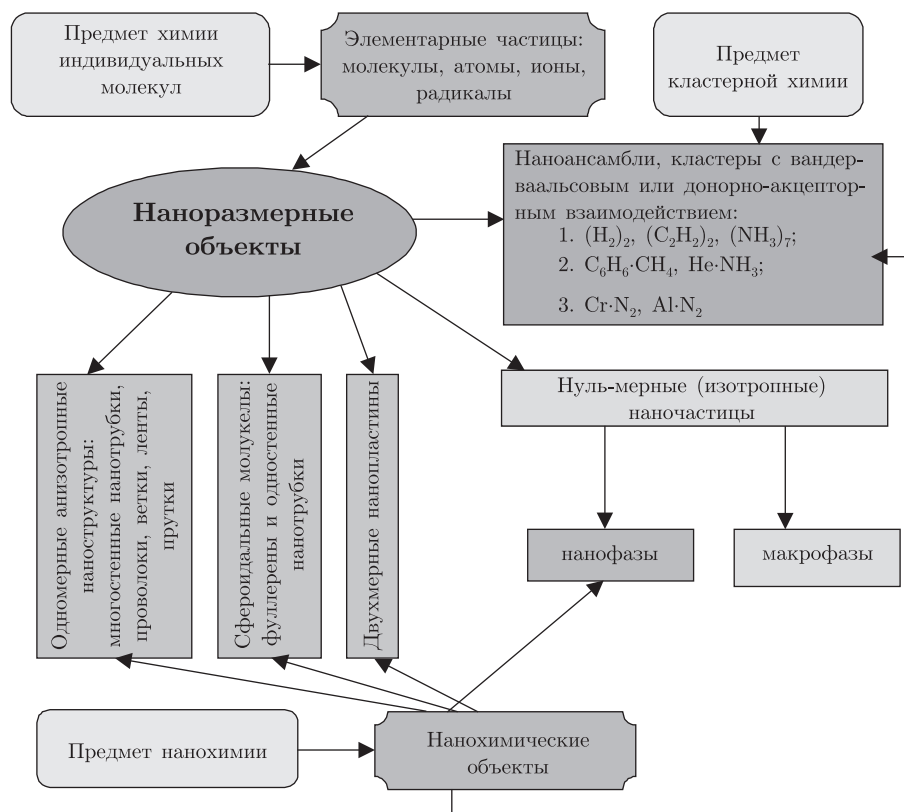
Рис. 2. Классификация нанообъектов