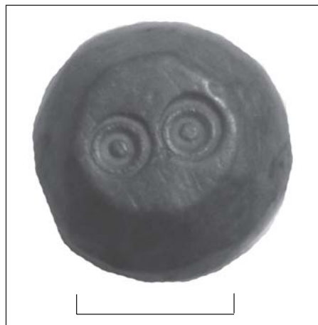
Рис. 2. Чернігів. Мідний предмет

Окрім розкопок на території Передгороддя, розвідувальні роботи, пов'язані з визначенням ступеню збереженості культурного шару (шурфовка), здійснено на відведеній під новобудову ділянці в районі сучасної вул. Белінського. Вона проходить по території т. зв. Третяка. Як відомо за матеріалами писемних та картографічних джерел XVIII—XIX ст., Третяк, що являв собою окремих укріплений міський район, за-