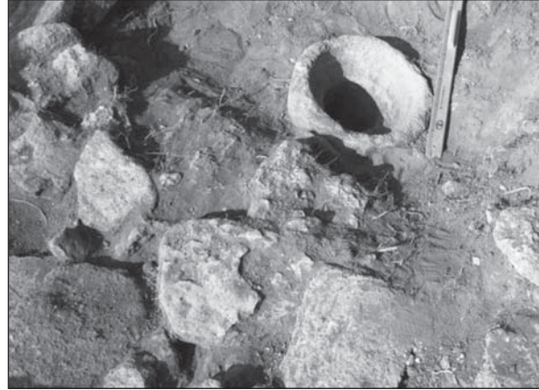
Рис. 3. Каменная ступа

С восточной стороны мостовой у самого борта квадрата 20 прослеживается линия новой кладки, сложенной из плоских плит и