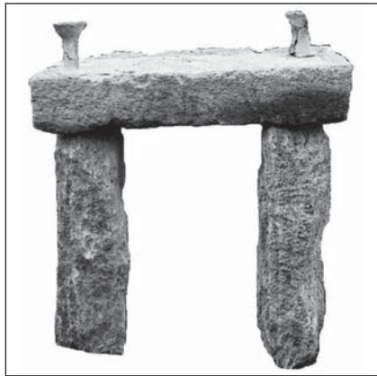
Рис. 2. Реконструкция стола

(рис. 1). Рядом, в каменном завале, найдены две плоские плиты, возможно, служившие ее подставками (рис. 2).