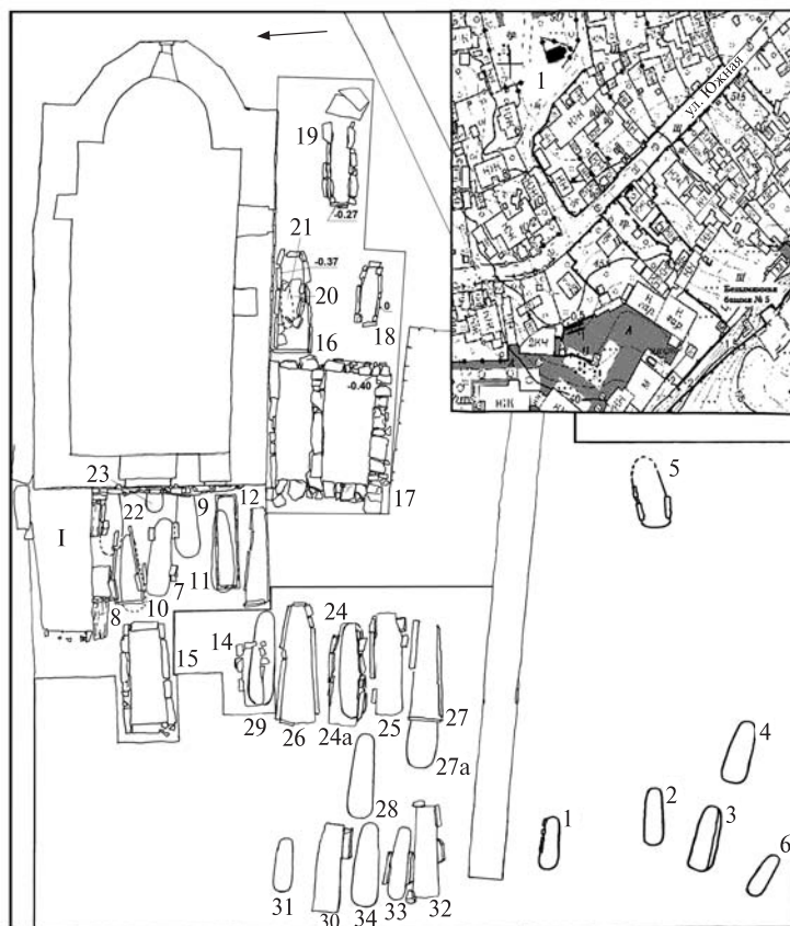
Рис. 2. Судак. План некрополя храма Параскевы

струкциями. Этот обряд иллюстрирует процесс оседания кочевого населения в византийском городе, сопровождавшийся принятием христианства. Подобная историческая ситуация для Юго-Восточного Крыма сложилась только в первой половине XIII в., когда под давлением татаро-монголов часть кочевого населения Причерноморской степи вынуждена была мигрировать на Крымский полуостров. Не исключено, что на раскопе 3 расположена наиболее ранняя часть некрополя, где продолжали хоронить и в более позднее время.