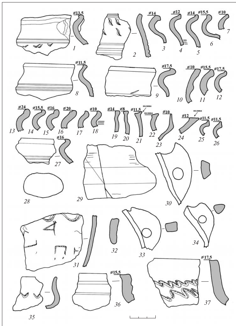
Рис. 1. Київ, вул. О. Гончара, 17–23. Знахідки із об'єкта 24

(рис. 1). Виявлено половину маленького горщика з врізним лінійним та хвилястим орнаментом, 12 фрагментів валикоподібних вінець, дев'ять валикоподібних фрагментів вінець з загином під покривку, п'ять фрагментів прямих вінець і фрагмент прямого вінця з жолобом по верхньому краю, товсте валикоподібне вінце — валик завернутий назовні, два товстих валикоподібних фрагментів вінець — валик завернутий всередину, сім фрагментів манжетоподібних вінець, два фрагменти вінець від тарілок, 15 фрагментів ручок горщиків та близько 200