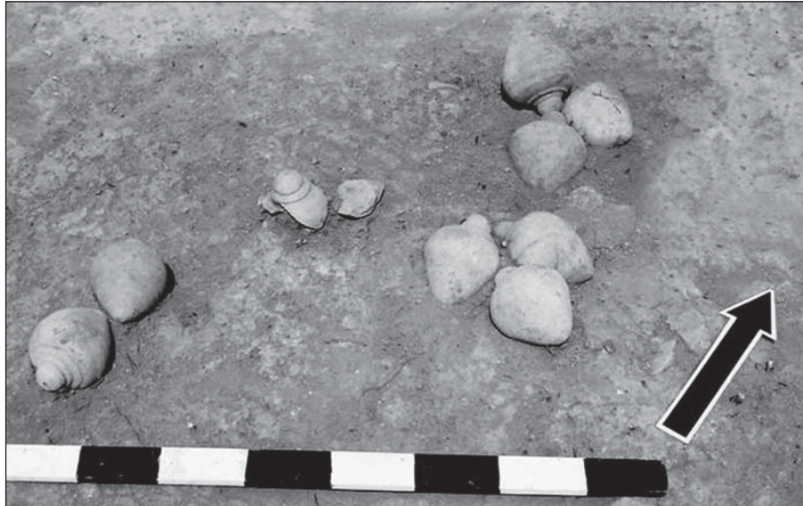
Рис. 2. Торговиця. Розкоп VIII, сфероконуси

турний шар складався з ґрунту, перемішаного з битою цеглою.