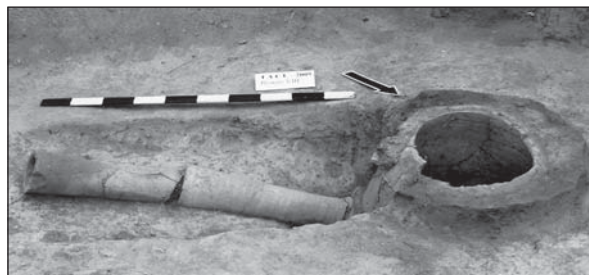
Рис. 1. Торговиця. Розкоп VIII, тандир

Лазня (розкоп IV) належить до споруд так званого східного типу ( hammam ). Розташована за близько 750 м на північний схід від центру села, з лівого боку від мосту через р. Синюха по трасі Кіровоград—Київ. Лазня була збудована на березі річки, за 41 м по прямій від плеся Синюхи. Добре помітний на поверхні куль-