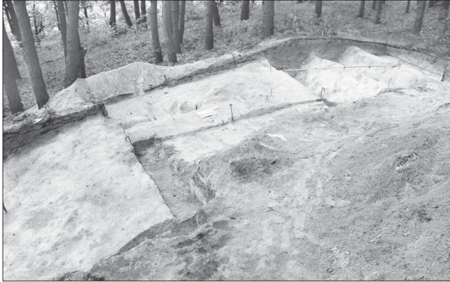
Рис. 2. Уроч. Коровель, городище. Рештки оборонних споруд на стрілці мису

го (рис. 2). В них виявлено дрібні фрагменти кераміки давньоруського часу, незначну кількість уламків ліпного посуду та окремі крем'яні відщепи. Тут, на глибині 0,2—0,3 м від сучасної поверхні, також виявлено два поховання без супроводу (XVIII—XIX ст.) та чотири стовпові ями. З культурного шару походять бронзова візантійська монета, залізне вістря стріли, пірофілітове пряслице та намистина з жовтого скла.