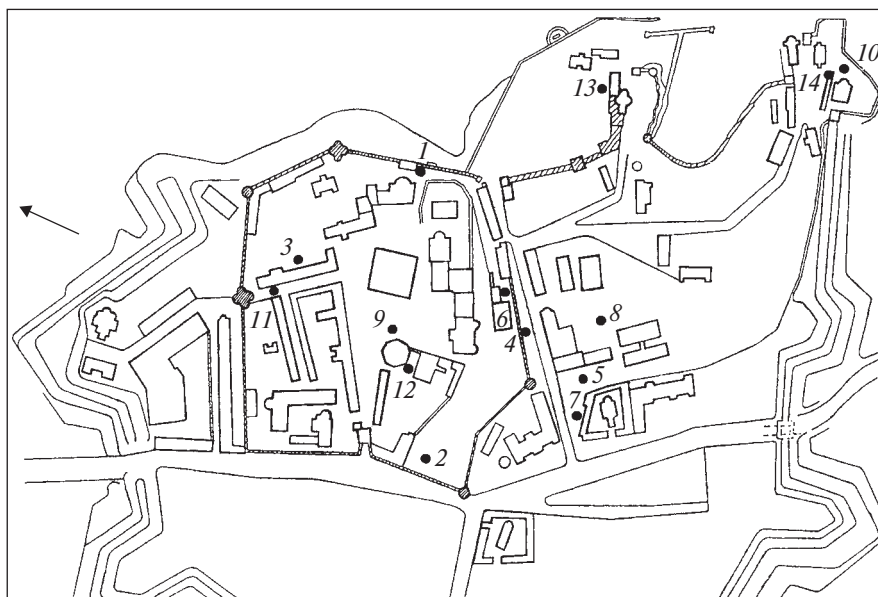
Рис. 1. Археологічні дослідження 2009 р. на території Києво-Печерського заповідника

Характер будівельних матеріалів і розташування об'єкта дозволяє припускати, що йдеться про рештки однієї з двох башт оборонних мурів XVII—XVIII ст., зведених по обидва боки Південної брами Києво-Печерської лаври, відповідно, за лінією східного та південного фасадів мазепинської стіни. Зображення цих башт є на одній з лаврських гравюр середини — другої половини XVIII ст. Обидві споруди до нашого часу не збереглися і докладної архівної інформації з цього приводу немає. З огляду на це, згадану ділянку можна вважати перспективною для подальшого археологічного вивчення.