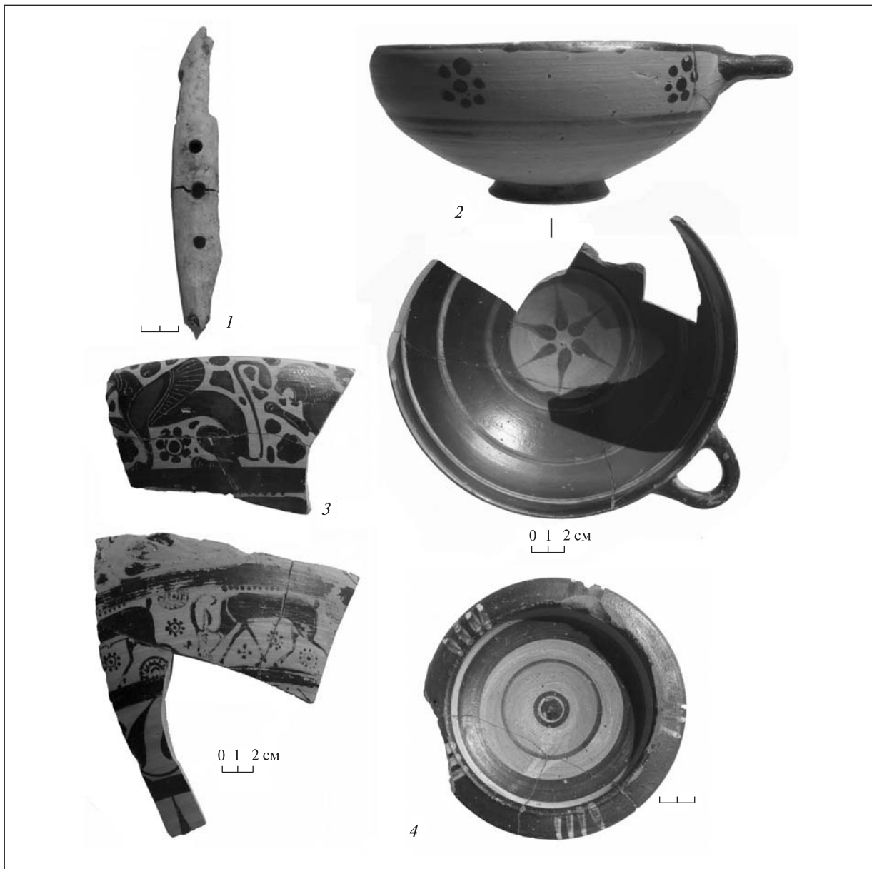
Рис. 2. Березань. Находки из хозяйственных ям 2008 г.

стены (38) и часть восточной, остальные кладки были разобраны в древности. Синхронные подвалу строительные остатки начала V в. до н. э. имели очень плохую сохранность, не позволяющую достоверно восстановить план сооружения, которому он принадлежал.