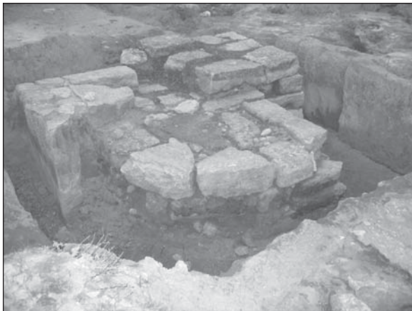
Рис. 2. Пилон проема ворот. Вид с юго-запада

ее полной сохранности. Объяснить устройство подобной вымостки с фундаментом можно в основном только тем, что на нее приходилась значительная нагрузка, а в месте ее расположения грунт был неоднородным и, следовательно, требовалось предотвратить просадку. Однако необычная криволинейная в плане форма этой вымостки и характер ее расположения у столба может объясняться необходимостью устройства здесь караульного помещения либо начала лестницы, ведущей на оборонительные стены.