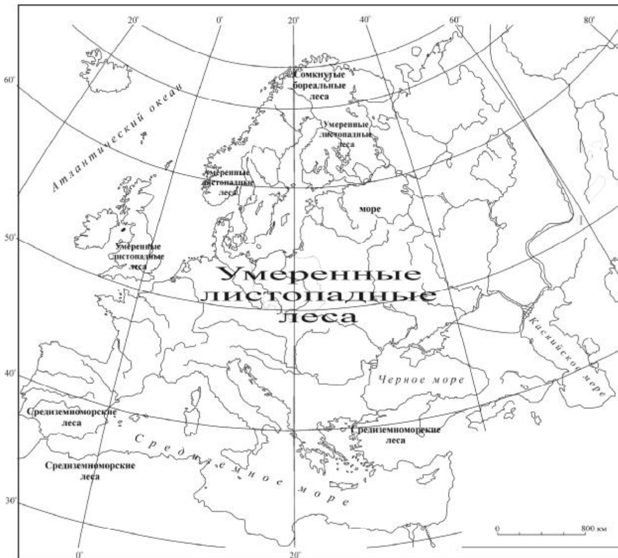
Рис. 1. Растительный покров Северного полушария в оптимум последнего плейстоценового межледниковья

Представленная кривая (рис. 2) отражает изменения растительного покрова в северной части Центральной Европы, в районах существенного влияния покровного оледенения. Но, как видно на ней, даже в этих районах лесные группировки после некоторого сокращения занимаемых площадей в течение ранних стадиялов Herning и Rederstall смогли практически восстановить свои границы во время следующих за ними интерстадиалов Amersfoort/Brorup и Odderade (рис. 2). Основные изменения характера лесных группировок произошли на уровне видов-лесообразователей: широколиственные породы были практически полностью вытеснены хвойными и мелколиственными. Даже в начале пленигляциала в