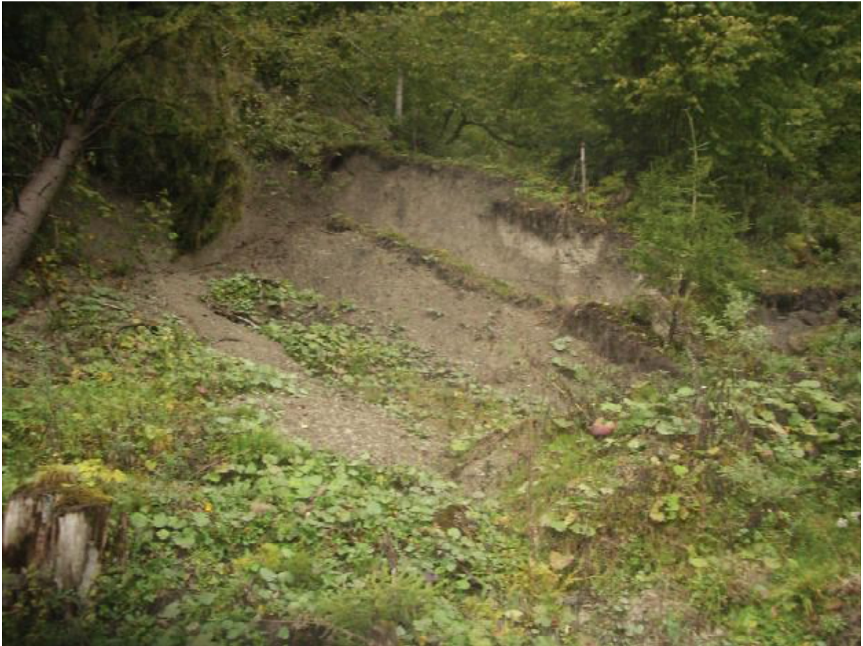
Рис. 3. Стінка відриву сучасного осуву

тавлені утвореннями палеогенової, неогенової та четвертинної систем і мають значне поширення в регіоні. В палеогенових відкладах виокремлюються утворення ямненської та бистрицької світ. Найпоширенішими серед потенційно осувонебезпечних утворень є відклади менілітової та кросненської світ, що складають кросненський тип стратиграфічного розрізу.