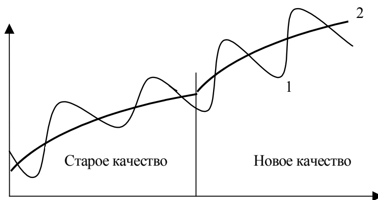
Рис. 2. Прогрессивный процесс циклического изменения состояния макроэкономических систем

Количественно процесс постоянного роста результирующей составляющей хорошо описывается производственными функциями в неоклассических моделях экономического роста. В них основными факторами производства, с одной стороны, выступают капитал, труд и научно-технический прогресс, которые также являются материальными факторами производительных сил, а с другой – вместе с результатами производства они являются объектами присвоения в системе отношений экономической собственности. В совокупности эти системы определяют качественное состояние макроэкономической системы, где