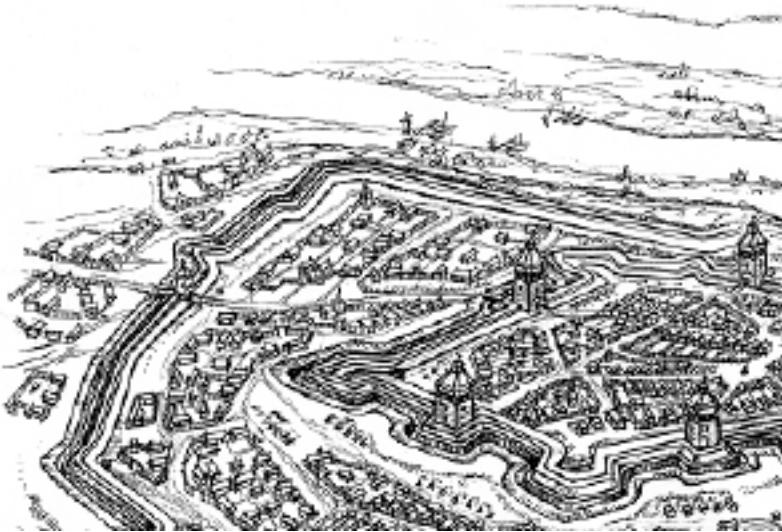
Рис. 1. Загальний вигляд Богородицького міста наприкінці XVII ст. Малюнок-реконструкція О. Харлана

five Nova et accurata Turcicarum et Tartaricum Provinciarum intra fluvios» цього часу і цих же авторів [25].