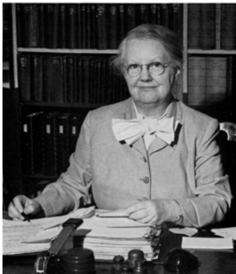
Маргарет Кросс Нортон American Archivist. – October 1961. – Vol. 24, № 4.

Серед істориків набула поширення думка, що Комісія з питань державних архівів виконує лише свою первинну функцію – підтримки державних архівів. Основний інтерес істориків тут полягав у збереженні архівних документів. Оскільки бракувало коштів та бажання проводити індивідуальні дослідження, історики відмовлялися від своїх зобов'язань перед Комісією. У 1919 р. Рада Асоціації на пропозицію Евартса Б. Гріна (Evarts B. Greene), секретаря Виконавчої Ради, припинила функціонування Комісії з питань державних архівів та створила Спеціальний комітет (під головуванням Віктора Х. Палтсіца) з метою підготовки до друку згаданого Підручника з архівекономії.