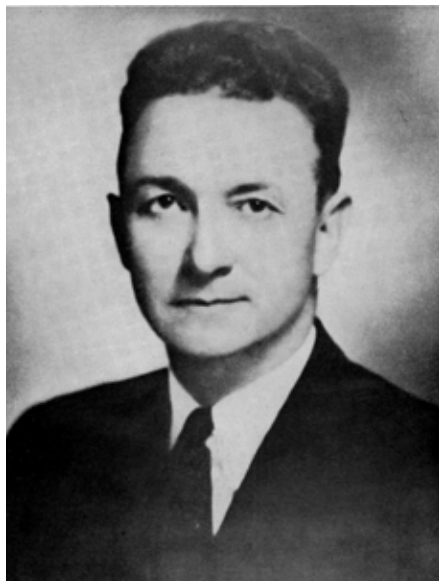
Альберт Рей Ньюсом American Archivist . – October 1961. – Vol. 24, № 4.

брали на себе більшість обов'язків, які належали раніше Асоціації. Початок Другої світової війни та зростання байдужості з боку істориків унеможливили будь-які починання Комітету державних архівів Асоціації, що й спричинило припинення його діяльності у 1947 р. До 1950 р. всі Комітети Асоціації, які займалися архівними питаннями, також перестали функціонувати.