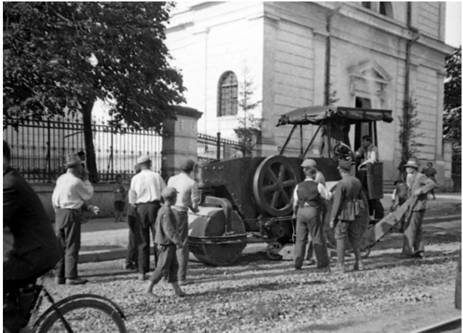
Коломия [1937 р.].