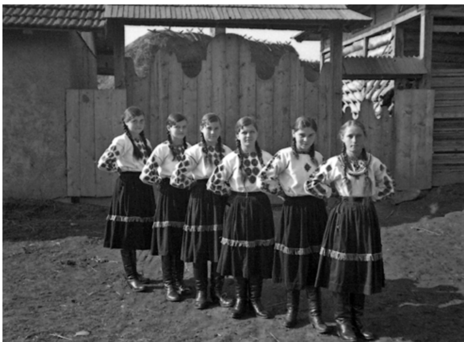
“Хліборобський Вишкіл Молоді” при товаристві “Сільський господар” у с. Балинці, 20 березня 1938 р.