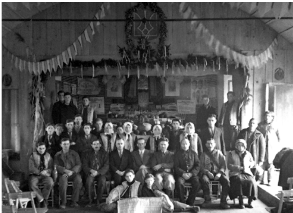
Товариство “Сільський господар” у с. Коршів [1937 р.].