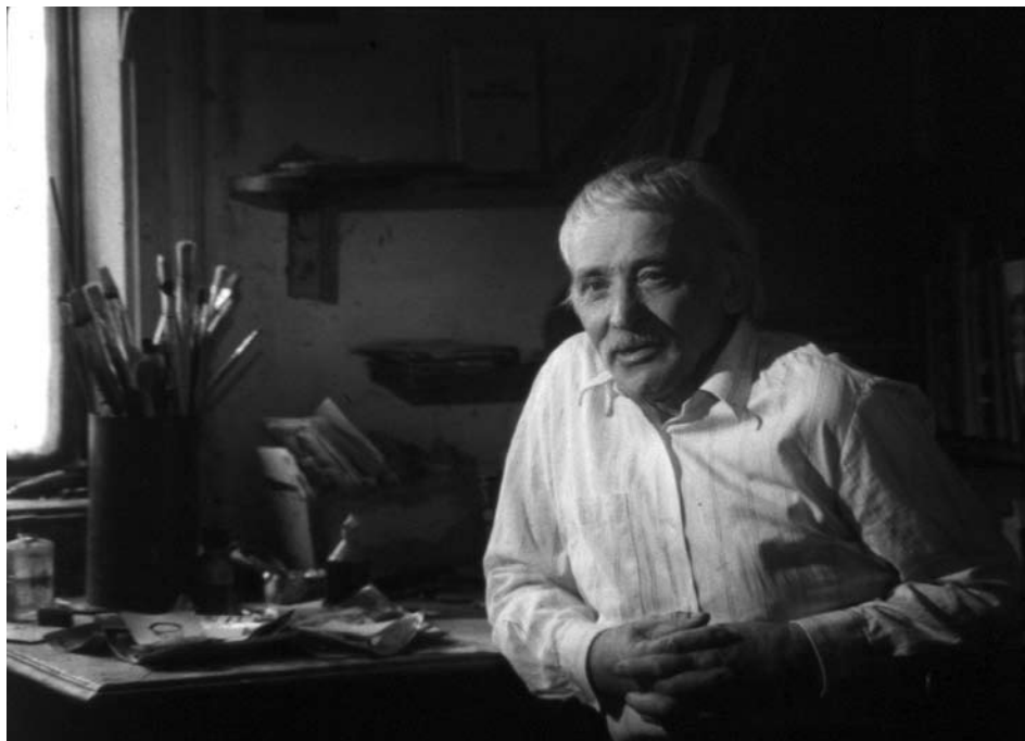
Український художник О. І. Заливаха у майстерні. м. Київ, 1992 р.

ЦДКФФА України ім. Г. С. Пшеничного, кадр із кінодокумента од. обл. 12137-II-3.