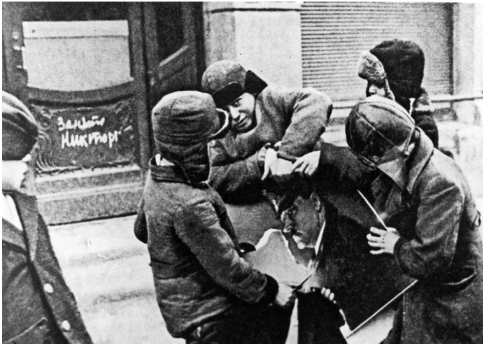
Діти рвуть портрет А. Гітлера після звільнення Миколасва. 1944 рік.