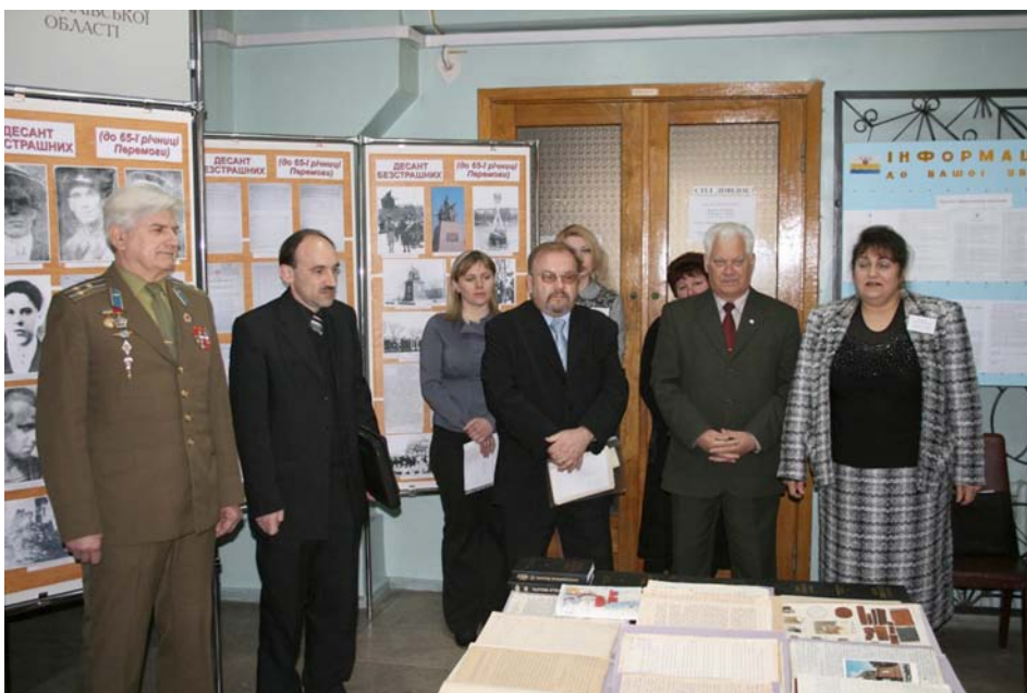
Відкриття виставки “Десант безстрашних” у Державному архіві Миколаївської області. Фото 2010 рік.