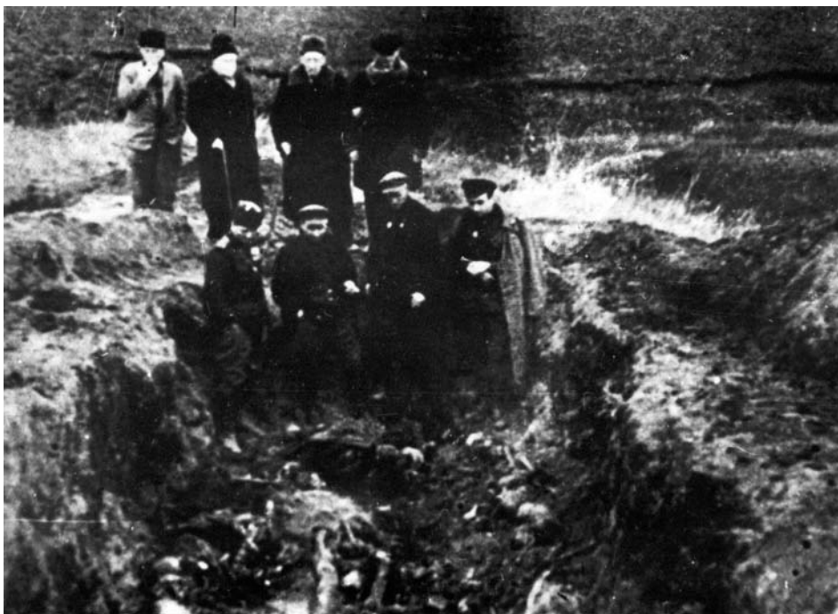
Члени Надзвичайної державної комісії з розслідування нацистських злочинів оглядають могилу в'язнів гетто у с. Богданівка Доманівського району (1944 р.) 1944 рік.