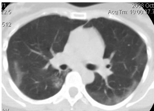
Рис 3. КТ-ОГК. Изменения по типу «матового стекла», с субплевральными инфильтративными тенями.

3. Двусторонние ретикулярные изменения в базальных отделах легких, с минимальными изменениями по типу «матового стекла».