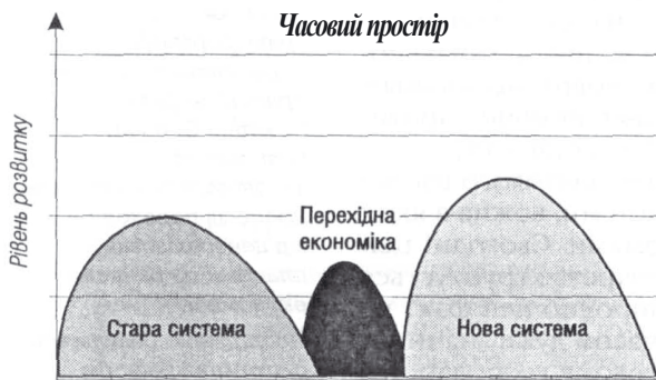
Рис. 2. Перехідна економіка міжсистемного типу

Такий стан перехідної економіки може бути вираженим у двох формах: революційної і реформістської перехідної економіки. Перша ( революційна ) формується внаслідок стихійних шоків, коли можливе повне знищення старої системи, в результаті чого виникає необхідність особливого перехідного періоду для створення якісно нової економічної системи. Друга форма транзитивної економіки – реформістська – склалася відносно недавно у зв'язку з переходом постсоціалістичних країн до ринкової економіки. Ця відносно нова форма перехідної економіки вирізняється специфічними особливостями, насамперед – своєю цільовою спрямованістю, а також свідомо ініційованим і державно регульованим процесом, здійснюваним згори. Це – цілеспрямована трансформація на відміну від революційного процесу, що ініціюється знизу, тобто в народних масах, і відбувається в основному стихійно.