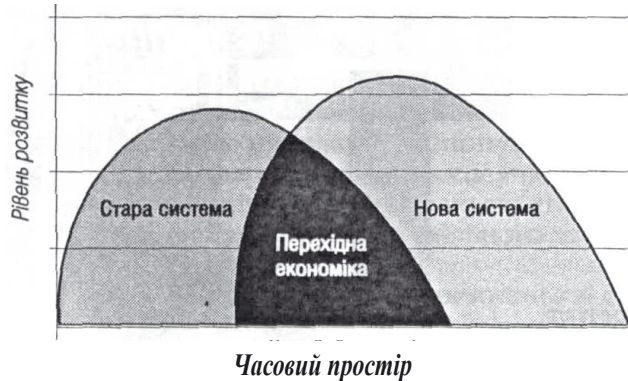
Рис. 1. Перехідна економіка внутрішньосистемного типу Джерело: [7, С.44 ].

типу, що має внутрішньосистемне походження. Особливістю такої економіки є те, що вона, маючи різні форми прояву, не торкається глибинних підвалин системи , в межах якої вона виникає.