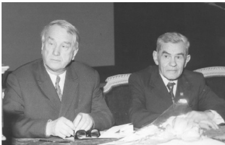
Директор Государственного Эрмитажа Б.Б. Пиотровский и И.Г. Спасский на торжественном заседании в Эрмитажном Театре, посвященном 70-летию И.Г. Спасского. 1974 г. (вверху справа)