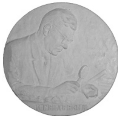
Козлов А.В. Медальон в честь И.Г. Спасского. Гипс. 1974 г. (уменьшено)