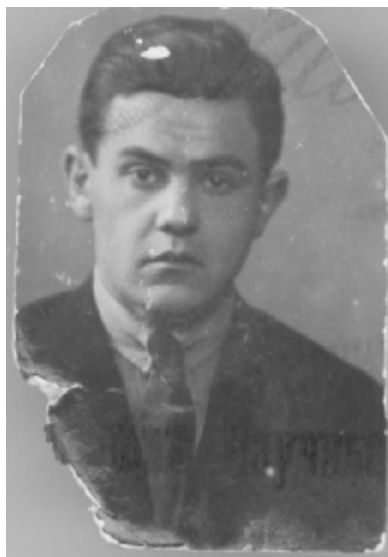
И.Г.Спасский. Начало 1930-х гг.