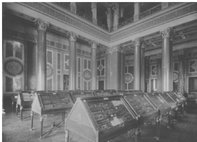
Показательная выставка Отдела нумизматики Государственного Эрмитажа в Двенадцати колонном зале Нового Эрмитажа. 1930-е гг.