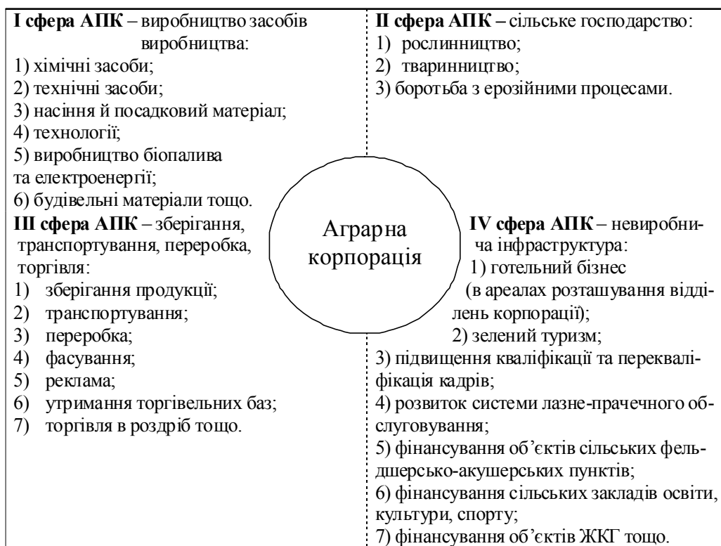
Рис. 1. Перспективні напрямки діяльності аграрної корпорації

власний фінансовий ризик, якщо купуватиме акції кількох корпорацій. Кредитори можуть надати претензії лише корпорації як юридичній особі, а не окремим акціонерам як фізичним особам.