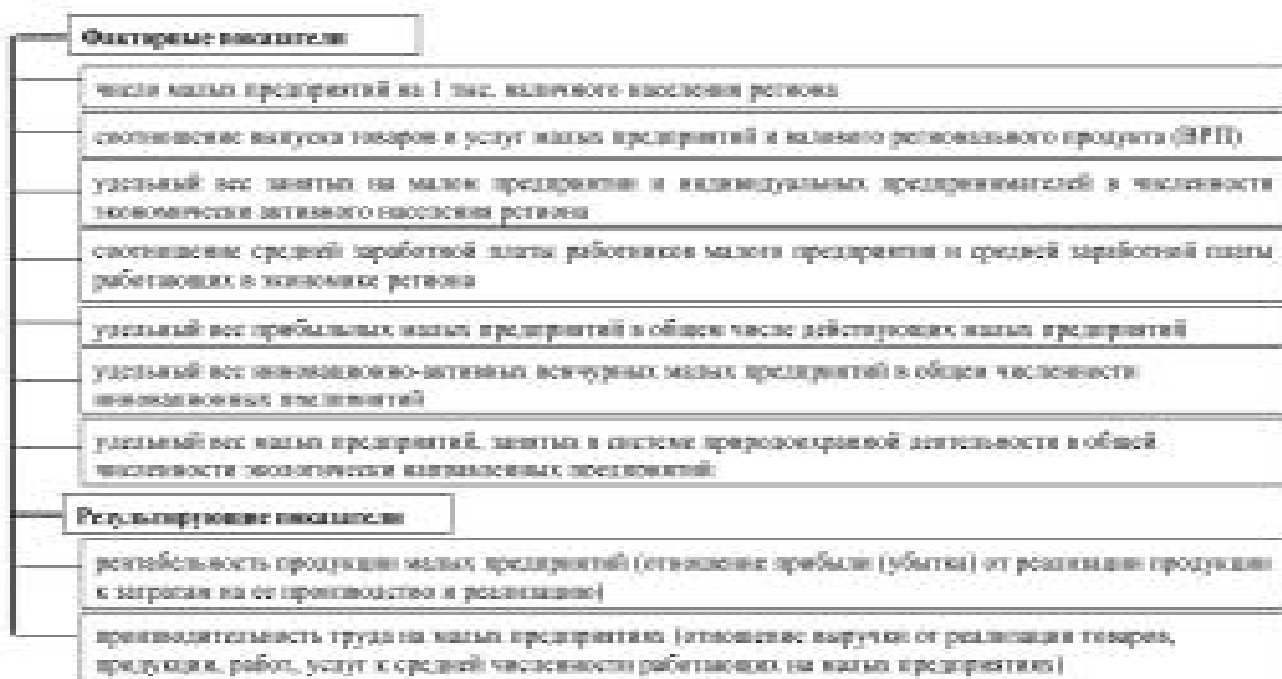
Рис. 4. Факторные и результирующие показатели экономической эффективности деятельности малых предприятий

свидетельствует о том, что без государственной поддержки невозможно обеспечить развитие малого предпринимательства. Так, под государственной поддержкой следует понимать, с одной стороны, сознательное создание государственными структурами экономических и правовых условий, стимулов для развития и конкурентной стойкости малого предпринимательства, а с другой стороны, вложение в него материальных и финансовых ресурсов, которые, в свою очередь, на начальных этапах должны носить либо безвозмездный, либо льготный характер.