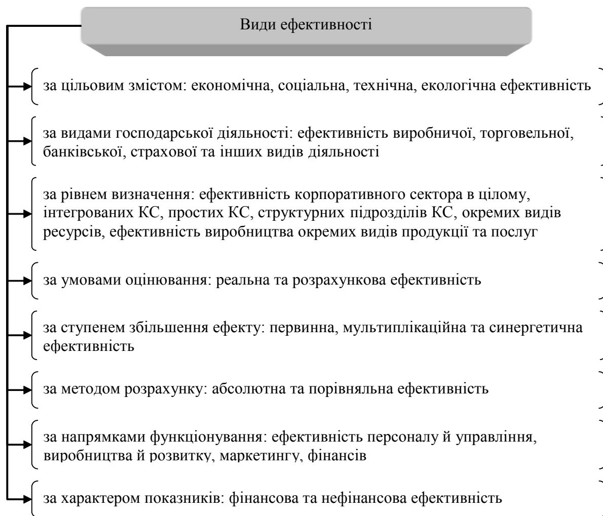
Рис. 1. Класифікація видів ефективності*

*Складено автором на основі даних [14, с. 518; 15, с. 285; 16, с. 451 — 452]