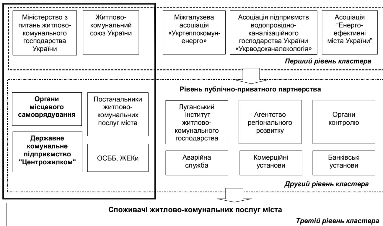
Рис. 2. Структура кластера в житлово-комунальному господарстві міста.