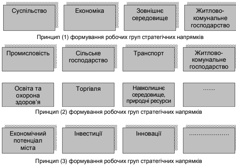
Рис. 2. Відомі принципи формування робочих груп стратегічних напрямків.