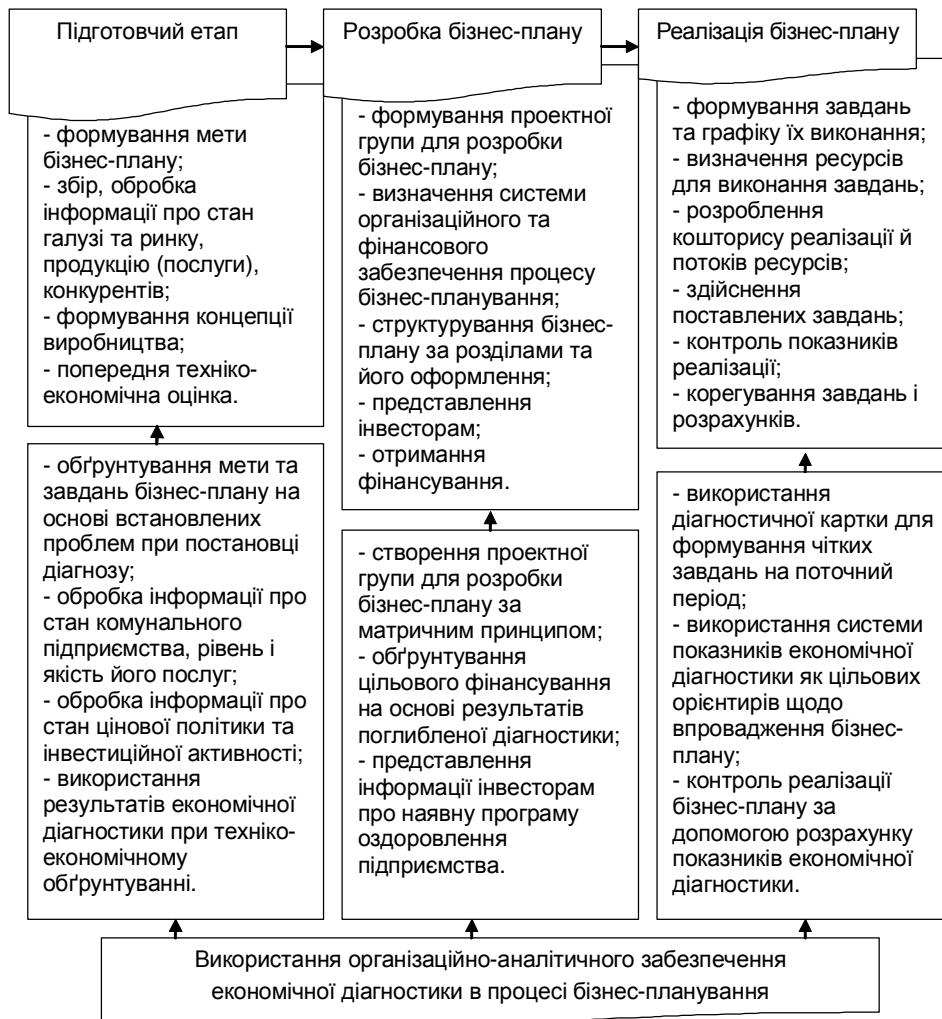
Рис. 1. Послідовність розробки бізнес-плану для комунальних підприємств із використанням результатів економічної діагностики.

бізнес-планів із використанням організаційно-аналітичного забезпечення економічної діагностики пропонується на рис. 1.