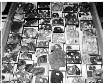
Рис.2. Ящик с музейными предметами

Автоматизация работы с научно-справочной информацией о музейных предметах позволяет решать следующие задачи: