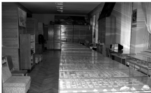
Рис.1. Зал монографических палеонтологических коллекций

Для обеспечения эффективной работы с огромным массивом информации, заключенным в музейных предметах, требуется применение современных информационных технологий. В настоящее время с применением СУБД Access [4] разрабатывается база данных монографических палеонтологических коллекций.