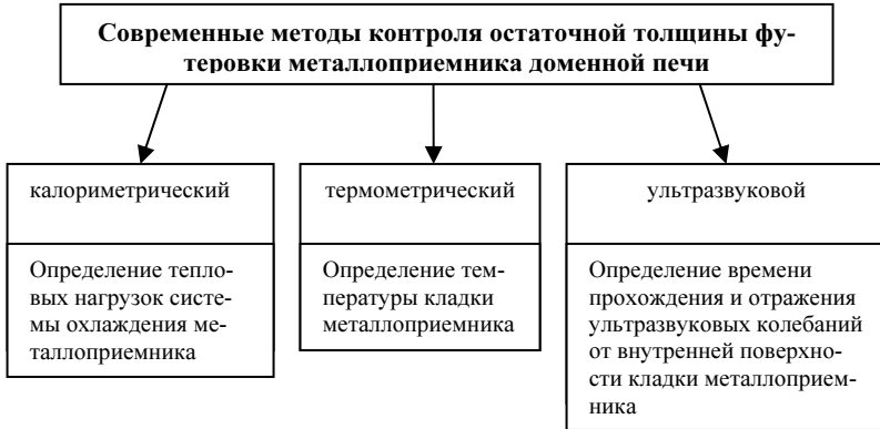
Рис.1 Современные методы контроля остаточной толщины футеровки металлоприемника доменной печи.

– обеспечивается определение локальных участков с повышенными тепловыми нагрузками, а также степени зарастания или засорения трубок холодильников.