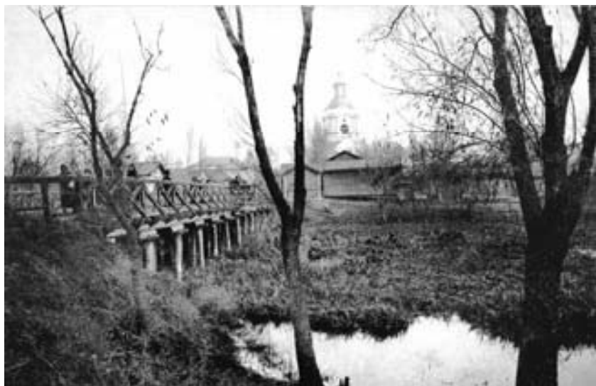
Ніжинські мости через р.Остер. Зверху – Магерський, посередині – Інститутський, унизу – Московський. Фото другої по- ловини ХІХ ст. (до статті Ігоря Ситого «Цікавий доку- мент із історії мостобудування на Чернігівщині»)