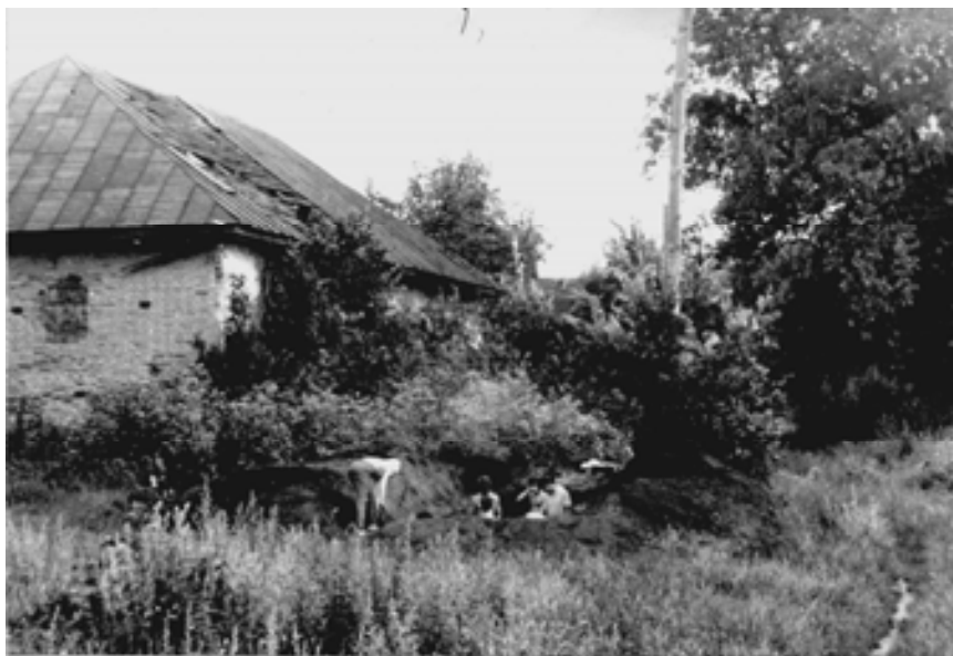
Мал. 7. Археологічні розкопки в урочищі “Городок”. Фото 1990 р.

Кіріпичников А.Н. (Санкт-Петербург, Росія), Коваленко В.П. (Чернігів)