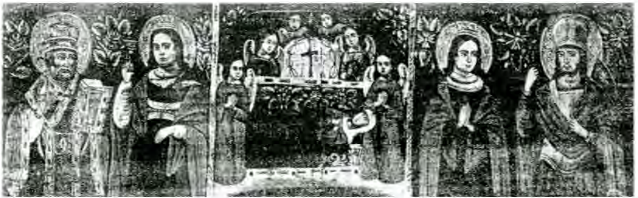
З експозицій виставки в Музеї Івана Гончара. Триділяна ікона з Уманьщини. Успіння Богородиці зі святыми. XIX ст. Полотно. I. Св. Микола і св. Варвара. II. Успіння Богородиці. III. Св. Євдокія і св. Іван-воїн.

ва. Зображення на бароковому портреті, як правило, вимальовується на темному просторовому тлі, що було локальним варіантом формальної системи тенебризму загальноприйнятої в європейському образотворчому мистецтві. Під впливом професійного “вченого” мистецтва вона поширюється у трансформованому вигляді на народний іконопис 6 . Отже, звертаючись до прийомів об’ємно-просторового трактування зображення, які склалися у вітчизняній бароковій традиції, народний майстер разом з тим прагне нагадати в усіх компонентах свого твору, що перед нами ікона. Тому, окрім зображення святих у німбах, він звертається до образу сяючих у темряві квітів, що є переосмисленим у дусі естетики фольклору символом вічного життя. Лише в центральній частині ікони темне тло має виразно просторовий характер і сприймається як темрява навколо яскравого світла від свічок біля труни Богоматері. Відповідно до цього квітковий орнамент заповнює верхні кути, а також місце поряд з фігурою Богоматері, підкреслюючи в такий спосіб її зв’язок з світом і після смерті.