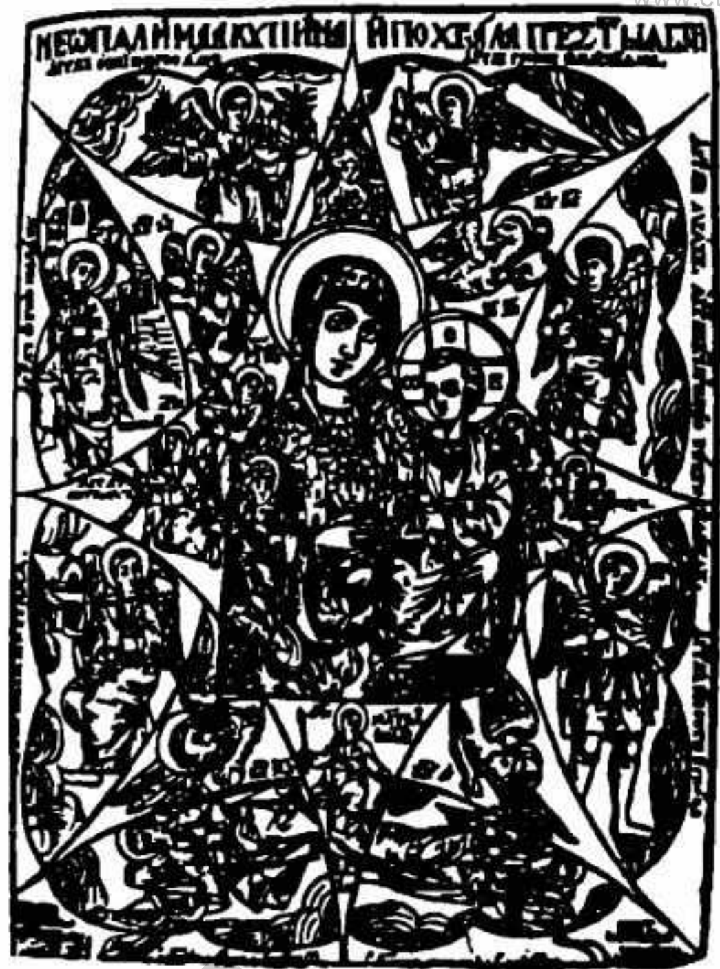
Майстер Л. М. (?) «Неопалима купина». 1626. Дереворіз.

На одній з них відтворено ікону «Неопалима Купина», що має дату — 1626, сигнет із зображенням місяця-молодика і сонця та підписані моногра-