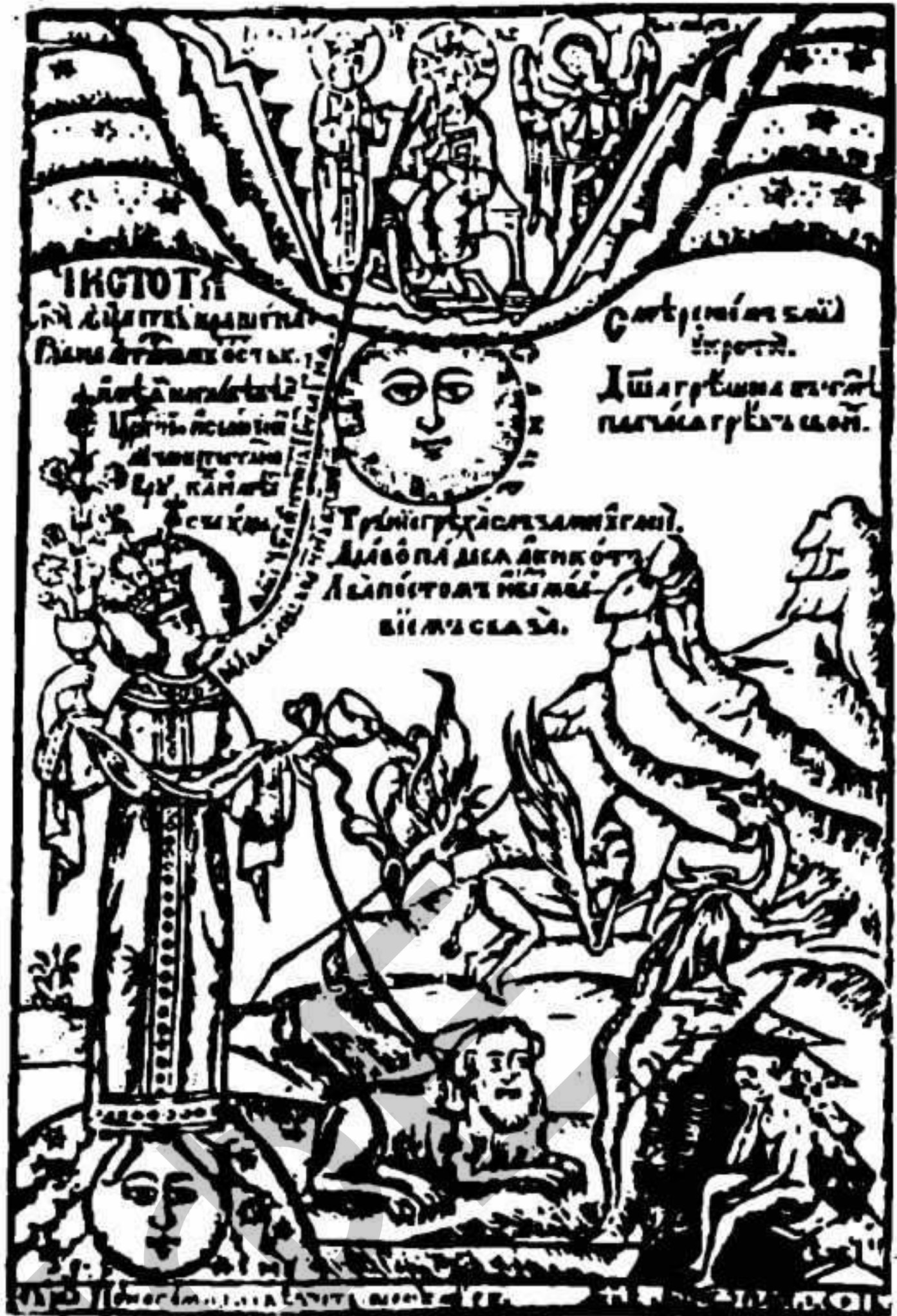
Майстер Л. М. (?) «Чистота аки дівиця». 1627. Дереворіз.

Ксилографію «Чистота аки дівиця» супроводжують тексти з «Скитського патерика» та «Пролога». Вона видрукувана на тому ж аркуші, що й згадані дереворізи «Страшний суд» та «Ліствиця». Згодом її бачимо в лаврському виданні «Акафістів» (1629 р.). Гравюра позначена двома вже згадуваними монограмами — ЛМ, ПБ та сигнетом. Вона також має дату — 1627 р. Це один з найпоетичніших за настроєм творів тогочасного українського граверства. В основу сюжету ксилографію покладено мотив подвижницької боротьби добра з лихом. Чистота зображена в одязі цариці, яка стоїть на місяці. В лівій руці тримає вазон з квітами, правій — чашу з своїми сльозами, якими гасить грішні помисли. На ужівці Чистота тримає лева —