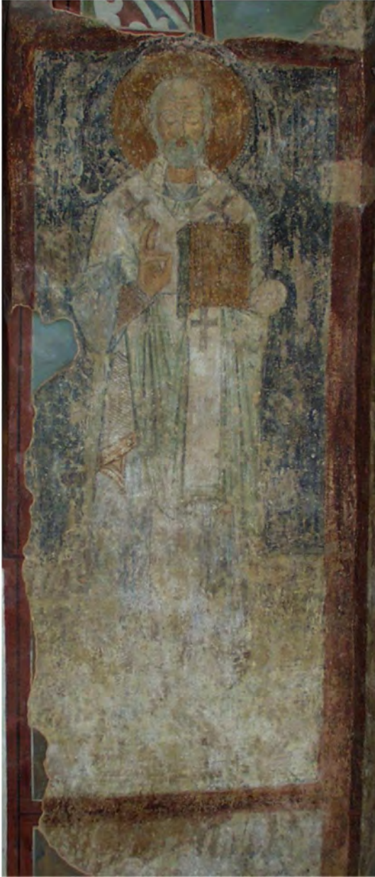
Свт. Микола. Фреска XI ст. над похованням Кирила II.

Цей вичищений з історії України за імперських часів факт поховання в Софії Сильвестра Косова багато про що говорить. Обидва митрополити були знайомими в Україні церковними і культурними діячами, високоосвіченими людьми, тому названі гетьмани покладали на них особливі надії щодо розбудови Гетьманщини. Косов походив із білоруської православної шляхти гербу «Корчак» на Вітебщині, отримав хорошу західну освіту і був «західником». А Гедеон, князь Святополк Четвертинський, був «східняком» з українсько-білоруської родини, вів свій рід з X ст. від князя Святослава Ігоровича й поріднився з попередником Мазепи гетьманом Іваном Самойловичем, був його сватом. У липні 1685 р. Гедеон був поставлений Московью Київським митрополитом, вийшов із підпорядкування Константинопольському патріархату та визнав верховенство патріарха Московського. Косов мав проукраїнську, а Гедеон – промосковську орієнтацію.