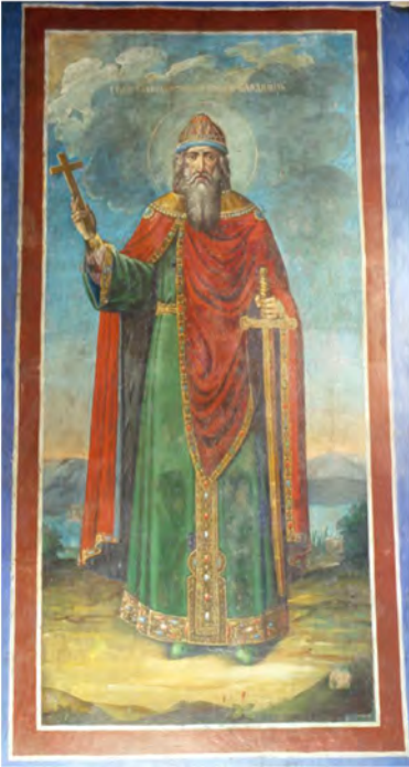
Князь Володимир Святий, олійний живопис, капела Івана Мазепи. XVIII ст.