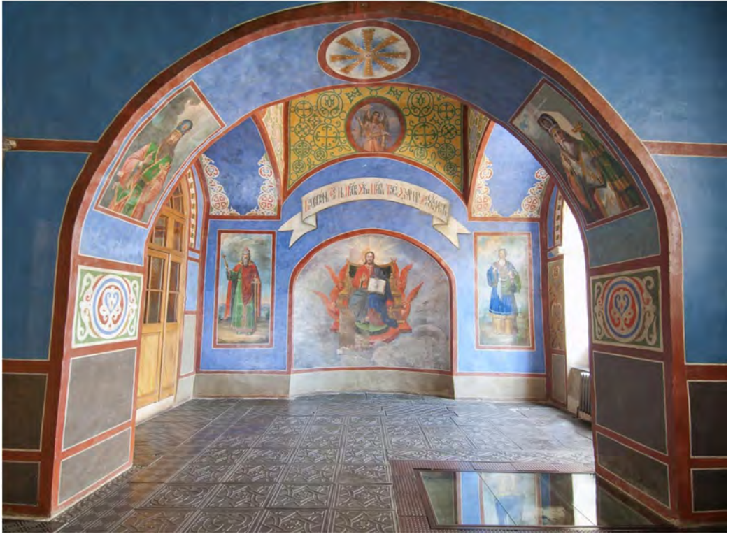
Капела Івана Мазепи в Софійському соборі. Початок XVIII ст.

ваному в стилі козацького бароко Софійському соборі вже за Мазепи розпочався новий розпис, який так само ніс оптимістичну ідею. За гетьманування Мазепи на місці зруйнованої західної зовнішньої відкритої галереї створено розкішно оформлений головний вхід. Від нього збереглися мідні позолочені рельєфні двері, прикрашені іконами в овальних медальйонах із зображеннями архангелів. Цей сяючий золотим блиском і яскравими фарбами чудовий витвір ювелірного мистецтва було виконано київськими майстрами.