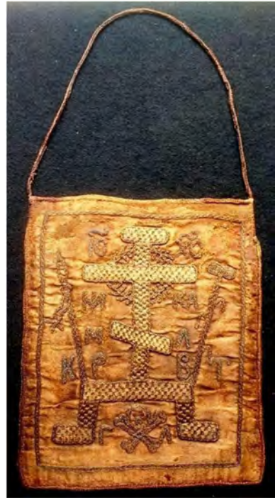
Параман Сильвестра Косова з його поховання. XVII ст.

А відтак доля поховання владики Гедеона Четвертинського (1686–1690), який уже перебував під омофором Москви, склалася інакше, ніж у поховання Косова. Згідно з офіційними джерелами, владики був посвячений у сан Київського митрополита 8 листопада 1685 р. в Успенському соборі Москви патріархом Якимом з волі царів Івана та Петра і царівни Софії. І вже з 1686 р. Київська митрополія мала підлягати тільки Московському патріарху. На це підкупом, обманом, лестощами, а також насильницьким шляхом і залякуваннями змусили згодитися Константинопольського патріарха Діонісія. Насправді, як правдиво говорить Константинопольський патріарх Варфоломій I, «Київська митрополія ніколи не була канонічно переданою Московському патріархату. Немає жодного офіційного документа, що підтверджує таке підпорядкування» 6 . Тож Київська митрополія та її святині ніколи не були власністю Москви. Гетьман Іван Самойлович, з оточення якого походив його наступник Іван Мазепа, згодом запевняв, що втрата церковної автономії України «обреталася аки в розтерзаній умі». Хоча гетьман Самойлович, змушений усіляко лавірувати в задушливих тенетах стосунків з Московією, сам висунув Гедеона на митрополита. Приводом для цього стало те, що Гедеона шанували і за його древній княжий родовід, і як православного подвижника, ледь не святого, який відмовився перейти в латинство, як найбільш визначного представника української знаті, та ще й угодну Москві «людину добру та тиху, що ніякої влади не ба-