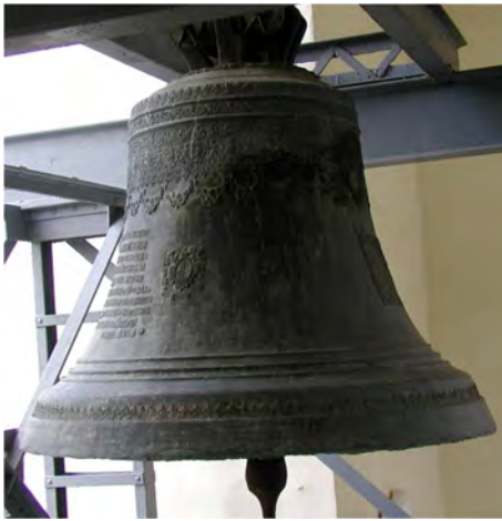
Дзвін «Мазепа». 1705 р.