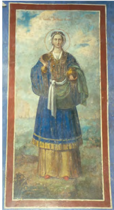
Свята княгиня Ольга, олійний живопис, капела Івана Мазепи. XVIII ст.

українка Мазепиних часів, по-жіночому чепурна й витончена, навіть кокетна. Вона струнка, гарна й духовно велична, з маленькою голівкою на довгій шії. Княгиня наче тягнеться до небес, а її пасок нагадує Богородичний. Це – символіка Богородиці Світопріймної Св'яті, притаманна акафістному образу Цариці Небесної, покровительки цариці (княгині) земної. Замість традиційного хреста або храму Ольга, як і св. Марія Магдалина, граціозно здіймає золотий дзбанок з миром, що символізує духовне зцілення, дароване святою княгинею від Бога людям. Але водночас княгиня владна, в її погляді бачимо силу правительки та глибину внутрішнього переконання в правоті віри. Це – позначений рисами західно-європейського мистецтва, створений добою Мазепи суто київський тип святої Ольги, зовсім не характерний московському. А відтак в образах Володимира та Ольги відбилася як життєва, так і символічна паралель з гетьманом Мазепою та його матір'ю Марією Магдалиною Мазепиною, яка була впливовою релігійною діячкою, ігуменею дівочого аристократичного Вознесенського монастиря на Печерську.