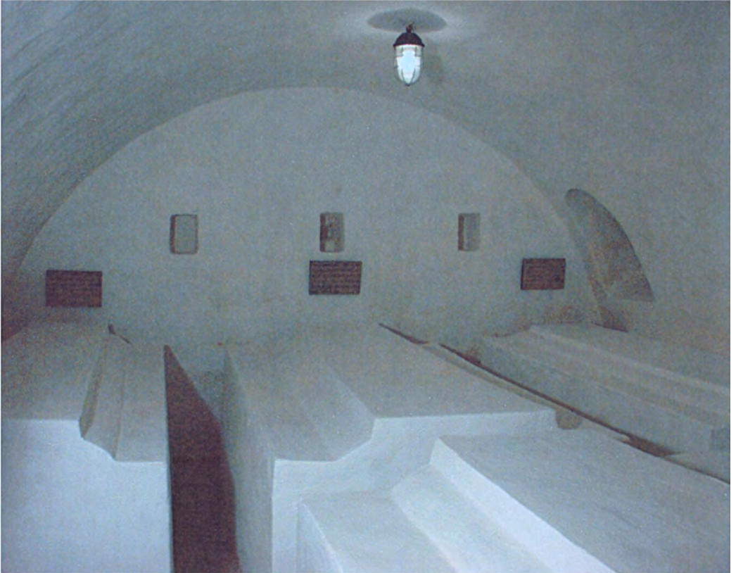
Митрополичий склеп у Софійському соборі. Кінець XVII – початок XVIII ст.

ді писаря Іакова про смерть і погребіння митрополита Рафаїла жодним словом не говориться про те, що цей розкішний склеп створений на його замовлення! І це при тому, що Іаков детально перелічив усі благодіяння цього митрополита в Софійському соборі й монастирі. Про що це свідчить? Виявляється, за три роки до того, 29 серпня – 12 вересня 1744 р. в Києві перебувала цариця Єлизавета Петрівна, яка 10 вересня відвідала Софійський монастир, побувала на вечері в митрополичих покоях вельми шанобливого й велеречивого щодо неї Рафаїла та багато обдарувала Свято-Софійський собор і самого митрополита. На моє припущення, саме тоді «розторопний» (як називає його Іаков) митрополит Рафаїл, який, звісно, вже думав про місце свого вічного упокоєння, бо був вельми недужим, виклопотав дозвіл цариці Єлизавети на поховання в Мазепиному склепі себе та своїх наступників на кафедрі.