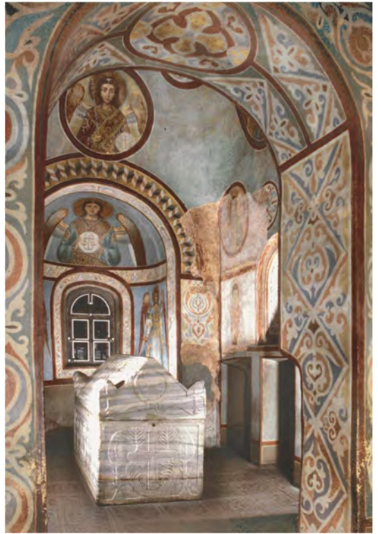
Саркофаг Ярослава Мудрого в Софійському соборі.

Так само і в Константинополі патріархів ховали не в Софійському соборі, а в другому за значенням храмі Св. Апостолів Петра і Павла, наступниками яких завжди вважали вищих церковних ієрархів. Тобто і Київські митрополити спершу мали власну усипальню у храмі Св. Апостолів, а в Софії першим поховали великого князя Ярослава, бо усипальня засновника собору Володимира була влаштована ним при побудові Десятинної церкви. А потім 40 років князів у Софії не ховали, адже на це вочевидь була заборона.