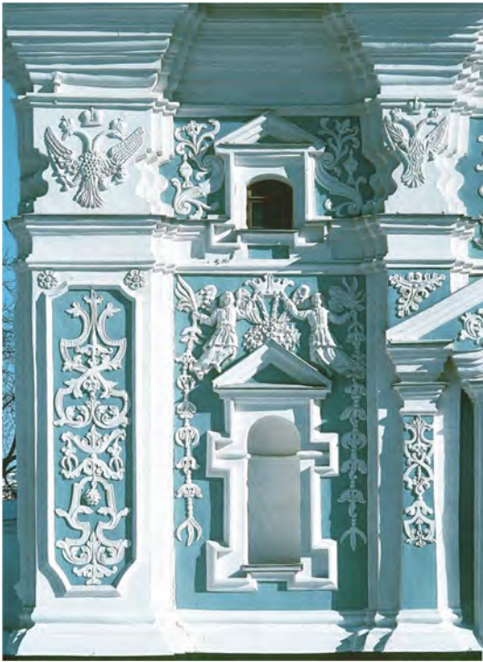
Софійська дзвіниця, вигляд з подвір'я, 1-й ярус. 1706 р.

Відомий український історик Сергій Павленко слушно зазначає, що Іван Мазепа виводив свій рід від Рюриковичів з полоцької гілки князів Бабичів Друцьких 13 . Ця вельми розгалужена княжа лінія походила від Ізяслава Володимировича (пом. 1001 р.), старшого сина Володимира Святого 14 . На нашу думку, як нащадок Володимира, гетьман, якого сучасники називали «новим Володимиром», звісно, не просто для «красного слівця», на початку свого правління отримав від Петра I, який покладався на підтримку Мазепи, спеціальний дозвіл на влаштування в Софії власної усипальні. Бо здавна правителі влаштовували свої усипальні при зайнятті престолу – це світова універсальна традиція. Так само вчинив до Мазепи його сучасник митрополит Гедеон Четвертинський, який також був з Рюриковичів, тому й заповів своє поховання біля гробниці Ярослава, що вочевидь теж було санкціоновано вищою світською та духовною владою Московії. Звісно, для перехоплення владної естафети у власні руки, бо, на задум Петра, над гетьманом мав стояти цар, а над Київським митрополитом – патріарх. Проте Мазепа мав інші розрахунки. Не випадковим є те, що на замовлення гетьмана в західну половину південної зовнішньої галереї була вбудована «капела Мазепи», де гетьман, а ніяк не московський цар, велично постає «новим Володимиром Київським», який був царем, що беззаперечно засвідчують його монети й печатки, на яких він фігурує в короні та мантиї.