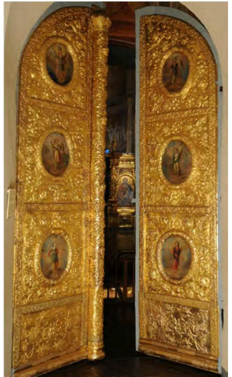
Вхідні врата Софійського собору. Початок XVIII ст.

Сучасники називали софійську дзвіницю прижиттєвим пам'ятником Івану Мазепі, а самого мецената – «новим Володимиром». Він був глибоко віруючою людиною й багаторічним ктиторм Церкви – у перекладі з грецької це слово означає особливо щедрого жертводавця, людину, яка заснувала, побудувала, відремонтувала чи обдарувала храм, є його світським настоятелем. У цьому гетьман Мазепа наслідував своїх державних попередників – великих київських князів. У 1690–1707 рр. за ктиторства Мазепи було здійснено капітальний ремонт собору – надбудовано другі поверхи галерей, над якими встановлено шість нових грушоподібних куполів, оновлено верхи старих веж. Собор засяяв золотом куполів і білизною стін. У перебудову