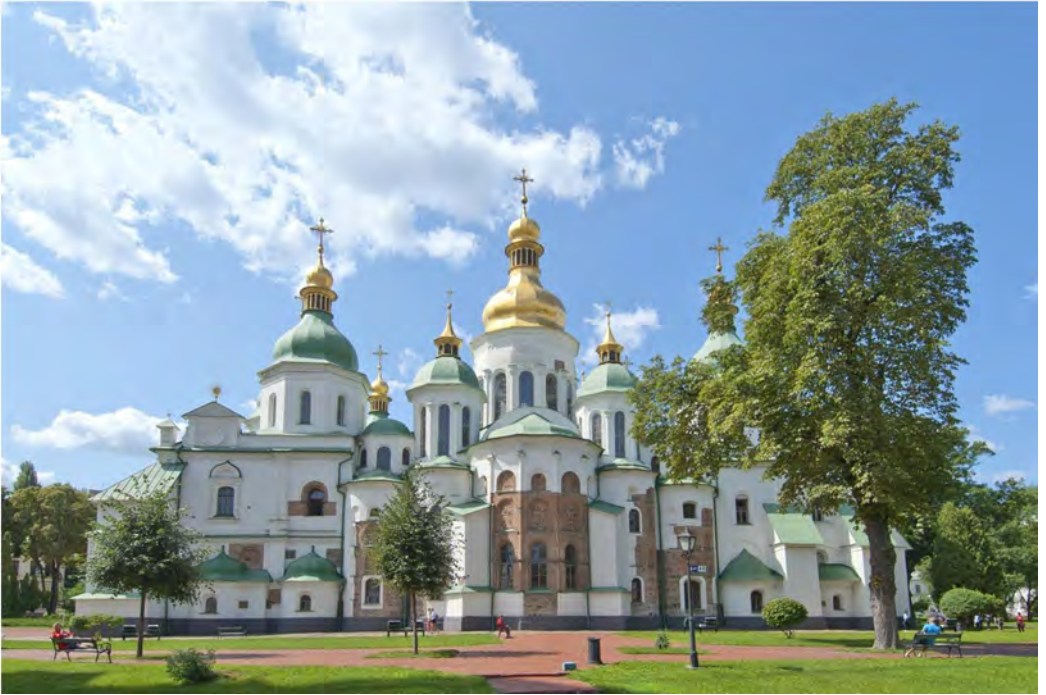
Софійський собор, східний фасад. Сучасний вигляд.

Прикметне, що склеп гетьмана був органічно вписаний в оновлений ним грандіозний ансамбль Софії як «тріумфальної церкви Премудрості Божої на святих київських горах», в якій акцентовано шляхетний родовід Мазепи і харизматичний характер його влади. Так впливає з «Тези на честь Івана Мазепи» 15 . До Софії вела Мазепина тріумфальна дзвіниця, яка донині формує давній образ Святого Києва. Вона багато оздоблена рослинним орнаментом, у мереживо якого вплетені фігури ширяючих ангелів у вигляді українських парубків у жупанах. Над ними – двоголові орли як візантійські символи митрополичої влади у злагоді із владою гетьмана. Це – архітектурний образ квітучої суверенної Гетьманщини, значимості її духовних і світських очільників та всього українського народу в історії.