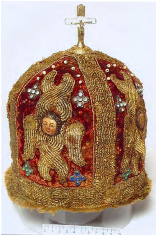
Митра Рафаїла Заборовського з його поховання. XVIII ст.

Відкриття дивовижного факту збереження мощів митрополита Рафаїла Заборовського, славетного київського чудотворця, важко переоцінити. Сталося чудо явлення святих останків людини, яка стільки зробила для Православної Церкви України та Києва, подарувавши нам його архітектурне обличчя. У 2022 р. була створена комісія з канонізації митрополита. 28 березня 2023 р. рішенням Священного Синоду Православної Церкви України Рафаїл Заборовський піднесений до лику святих. Наразі мощі митрополита Рафаїла відкрито шануються в Трапезній церкві Софійського монастиря, освяченій ПЦУ на честь святого князя Ярослава Мудрого.