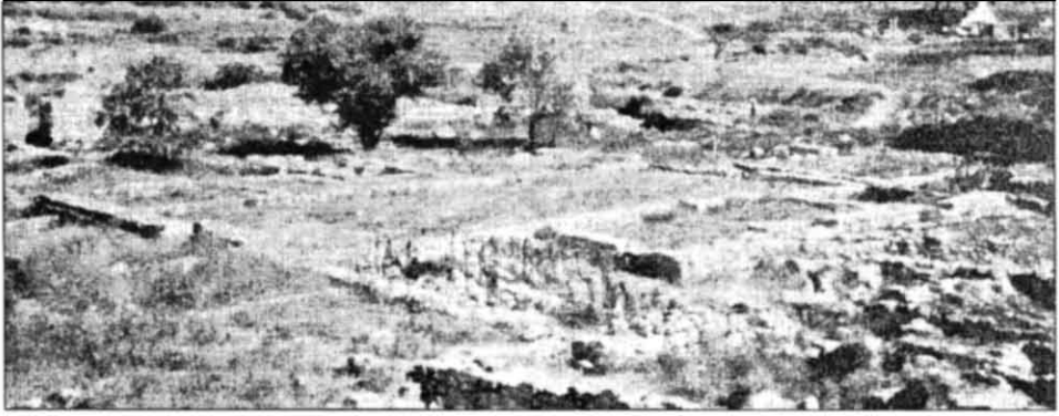
Рис. 3. Сучасний вид на північну частину середньовічного преторія Херсонеса з адміністративною будівлею

су» (δοῦξ). Так називали намісника великого адміністративного округу, до якого входило декілька малих фем. Головним завданням намісника було підтримання безпеки дорученої йому адміністративної структури 32 . Отже, після того як у другій половині X — першій половині XI ст. у Тавриці виникли феми Боспора та Сугдеї, Візантія зробила спробу централізувати свої північні володіння. Першим етапом стало об'єднання повноважень стратигів Херсона та Сугдеї в руках однієї особи (напис 1059 р.), а на другому етапі, між 1059 та 1066 рр., було засновано катепанат, до якого увійшли три таврійські феми.