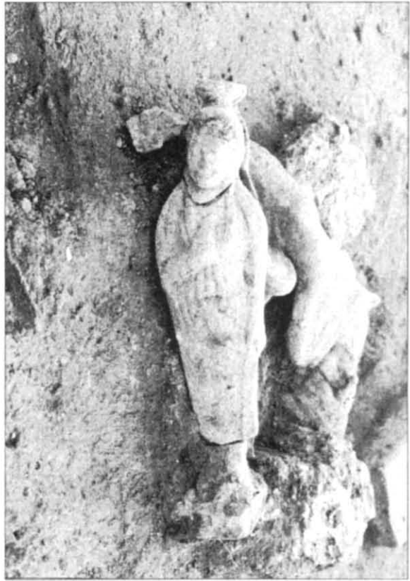
Рис. 3. Теракоти на підлозі храму Афродіти

Ділянка «Р-1в» (Репер перший східний). Ділянка розташована в центральній частині острова. Розкопки тут були початі в 1982 р. і ведуться до цього часу 13 . Найраніші будівельні рештки представлені комплексом ґрунтових споруд (жител і господарчих ям) другої половини VI —