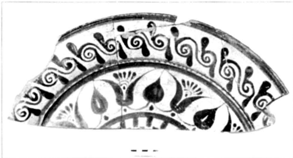
Рис. 4. Фрагмент родосько-іонійської тарілки (ділянка «О»)

території острова. Останні практично ніяк не торкнули античного поселення, і це можна розцінювати як позитивний момент, проте, з іншого боку, нічого не було зроблено для збереження унікальних археологічних об'єктів, що були розкриті в ході розкопок.