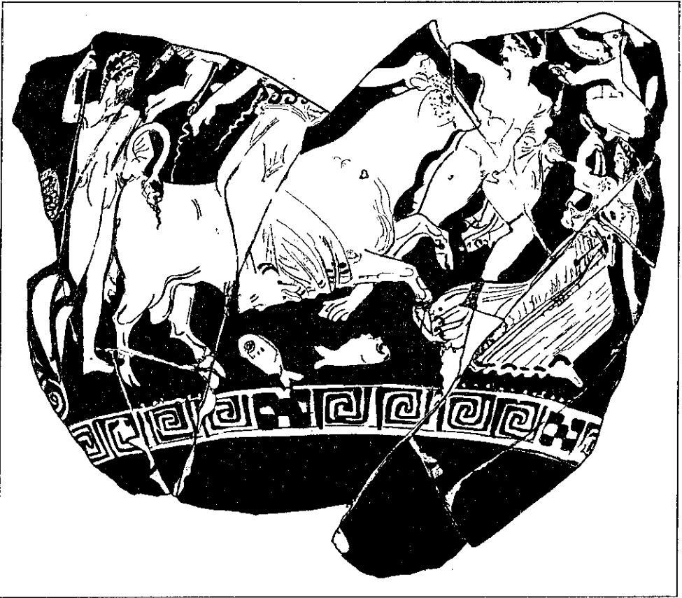
Рис. 4. Уламок кратера з Галущинського кургану