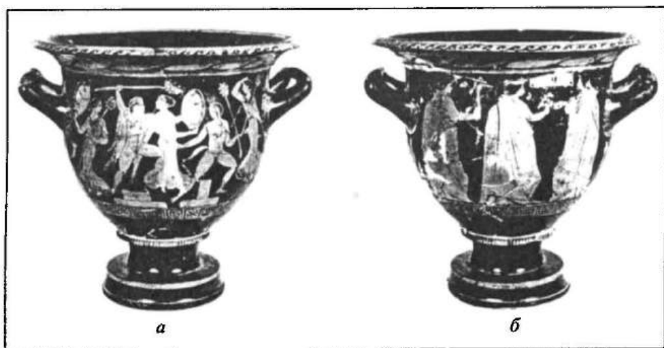
Рис. 1. Кратер з Бердянського кургану; а — лицьовий бік; б — протилежний бік

Найближчим до бердянського в нашій добірці за формою, характером декору, манерою розпису (особливо на протилежному боці) є фрагментований кратер із Західної могили кургану Ташенак, який було розкопано в 1989 р. біля м. Мелітополя 13 . Більша його частина втрачена (рис. 3). Під вінцями він прикрашений вінком з листя