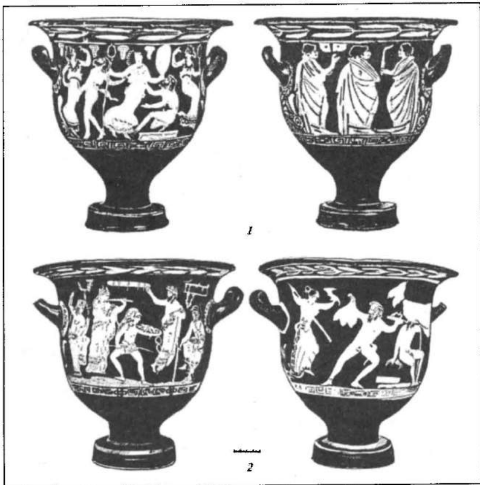
Рис. 2. Червонофігурні кратери: 1 — з Музею Ніколсона в Сідней; 2 — «київського майстра»