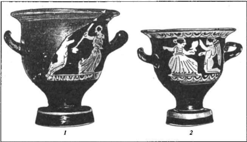
Рис. 6. Червонофігурні кратериски: 1 — к. 1 біля с. Грищенці; 2 — к. 93 біля с. Бобринця

скіфських могилах, тобто наявність кратера в кургані дозволяє розглядати поховану там особу як номарха 38 .