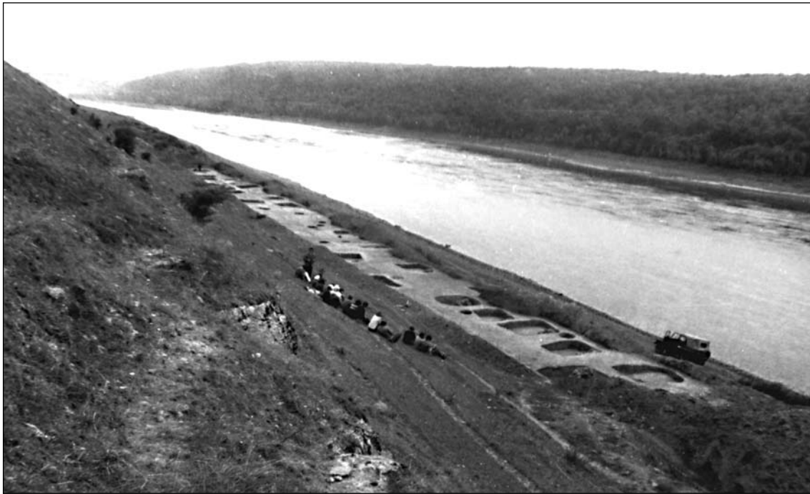
Ранньослов'янське поселення Рашків III. Розкопки В.Д. Барана

тованими пам'ятками двох хронологічних прогалін, наявність яких піддавала сумніву гіпотезу про давнє походження слов'ян і їх безперервне існування на території України в I тис. н. е. Одна з цих лакун охоплювала другу половину I — початок II ст. — час після занепаду зарубинецької культури в її класичному вигляді, друга — V ст., тобто час Великого переселення народів і формування ранньосередньовічних слов'янських культур. Заповнення цих прогалін дало можливість зробити принципово нові історичні висновки про те, що лісостепову смугу Південно-Східної Європи ніколи не залишало корінне місцеве населення. Саме ця територія, окреслена пам'ятками V ст., стала зоною формування ранньосередньовічних слов'янських культур.