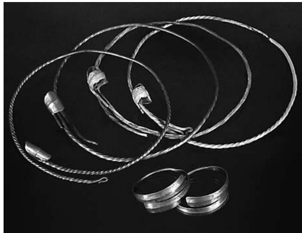
Скарб срібних прикрас VIII ст. із с. Андріяшівка. Розкопки Р.В. Терпиловського

По-новому висвітлено проблематику слов'янського розселення, початок якого припадає на кінець IV—V ст. Саме в цей час слов'янське населення Подесення та суміжних регіонів поширюється як у верхів'я Дніпра, у середовище «народів між балтами і слов'янами», так і в лісостеп, залишений частиною черняхівських племен. Трохи згодом слов'яни з'являються і в Подунав'ї. Вихідною територією міграцій було насамперед Середнє та Верхнє Подністров'я і Прикарпаття. На основі найхарактерніших ознак слов'янської матеріальної культури вдалося визначити шляхи розселення слов'ян, які ведуть вглиб Балканського півострова (пеньківська група) та на північ по Дунаю через Словаччину і Моравію у межиріччя Ельби і Заале (празька