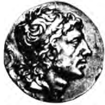
Рис. 4. Мітрідат VI Євпатор. Зображення на монеті