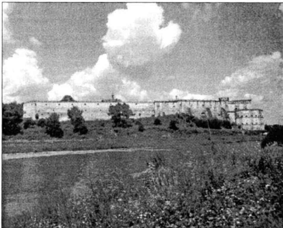
Рис. 1. Замок в Меджибожі. Сучасний вигляд.

тер, проте, на жаль, під час археологічних робіт на території сучасного замку не було виявлено решток оборонних споруд давньоруського часу. Як свідчать деякі місцеві краєзнавці, давньоруське місто Межибоже може знаходитись дещо в стороні від наявної фортеці середньовічних часів, а саме: на північний захід по плато, на якому знаходиться розглядуваний фортечний комплекс. Проте для перевірки цих припущень необхідне розвідкове шурфування приблизного району знаходження давньоруського міського ядра.