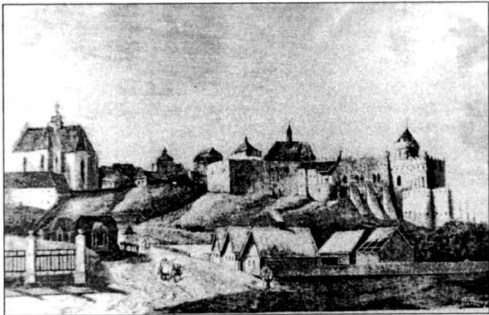
Рис. 2. Меджибізька фортеця. Загальний вигляд з південного боку (XIX ст.).

вуються могутні контрфорси, поява яких була викликана подальшим розвитком вогнепальної зброї та облогової артилерії: подібне підсилення оборонних стін мало контрбатареєне призначення. Верхи башт та мурів прикрашаються зубцями, розетками і стовпчиками (рис. 2).