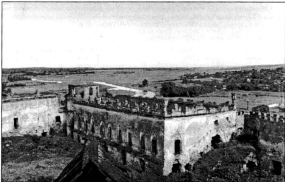
Рис. 6. Подвір'я замок. Вид на руїни палацу та донжон (сучасний вигляд).

кутність) найдавнішим в принципі оборонним спорудам, особливо укріпленням мисового типу (щодо аналогії, то можна навести досить показовий у цьому сенсі замок у Зінькові 22 ).