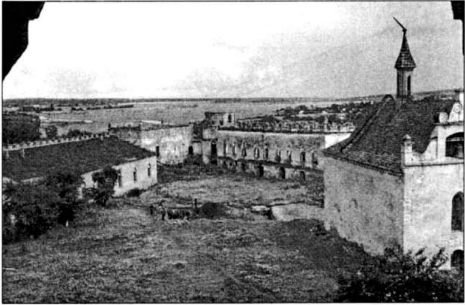
Рис. 5. Подвір'я замку. Вид на центральну частину з розкопом.