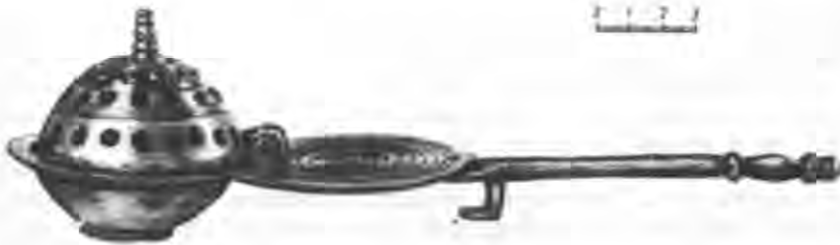
Рис. 8. Кадило-кацея. Вид в профіль. Ермітаж.

При розкопках (1985 і 1986 рр.) підвальних приміщень того ж будинку було знайдено два вотивних хрести: один з петлями на горизонтальній перемичці для підвісок, накладними медальйонами на перехресті (в оточенні рослинного орнаменту) і на нижньому кінці хреста (оправа одного з медальйонів збереглась), другий — з фігурними трилопатовими кінцями і гравірованими крапами по краю 29 . Такі пам'ятки відносяться до широко розповсюдженого у середньовізантійській період типу 30 чотирикінцевого хреста «із слізками» на кінцях, накладними медальйонами, підвісками на ланцюжках біля гори-