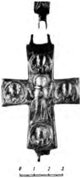
Рис. 2. Хрест-енколпійон із зображенням Богоматері та чотирьох євангелістів. Ермітаж.