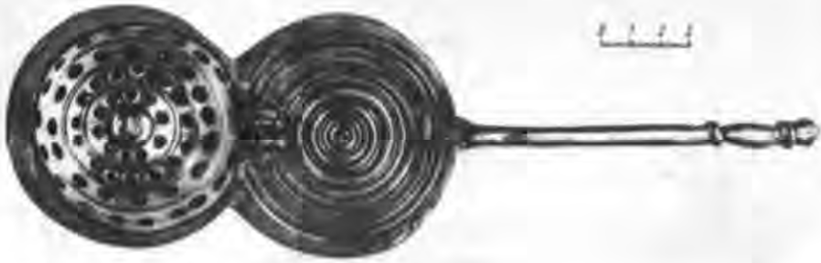
Рис. 7. Кадило-кацея. Вид зверху. Ермітаж.

Як зазначалося, зразки візантійського прикладного мистецтва з розкопок ХХ кварталу репрезентовані переважно двома групами виробів: бронзовим литтям (хрести й кадило) і керамікою — поливною з розписом або прикрашеною в техніці зграфіто, а також фігурним неполивним посудом 26 .