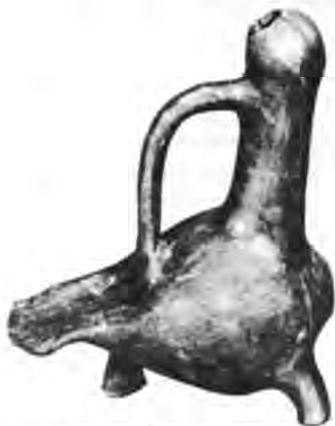
Рис. 16. Водолій у вигляді птаха. Вид в профіль. Ермітаж.

хню покришок, їх стінки і вушка з круглими отворами, що слугували для підвішування посудинок. За збереженими фрагментами можна вважати, що форма чашок нагадувала херсонеську лампаду з розкопок 1949 р., а оформлення покришок скопійоване з мусульманських пам'яток XII—XIII ст. 62