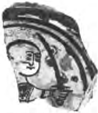
Рис. 13. Фрагмент блюда: сельджуцький воїн. Ермітаж.