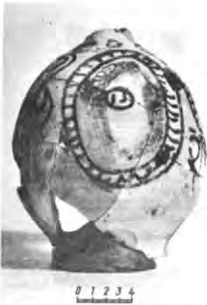
Рис. 9. Глечик з безконтурним розписом. Ермітаж.