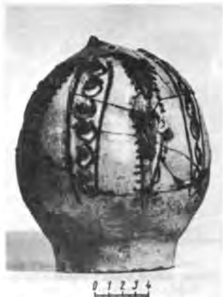
Рис. 10. Глечик з безконтурним розписом. Ермітаж.

підтверджують — окрім XIV ст. — точку зору О. Л. Якобсона. Побутування такої білоглиняної кераміки, а також червоноглиняного посуду, прикрашеного у змішаній техніці гравірування по ангобу в поєднанні з плямами зелено-коричневого розпису, припадає на XII—XIII ст. Типові зразки таких глечиків і тарілок були виявлені як у 1981—1987, так і в 1949—1951 рр. (рис. 11, 12).