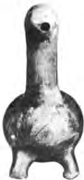
Рис. 15. Водолій у вигляді птаха. Вид в фас. Ермітаж.