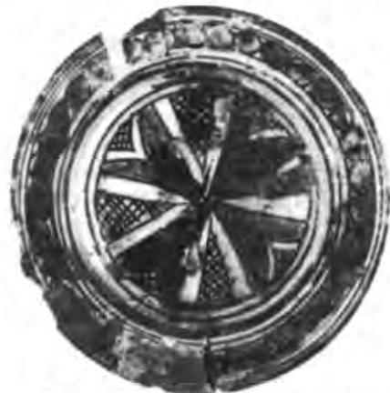
Рис. 12. Блюдо з чотирилисником. Ермітаж.