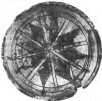
Рис. 11. Блюдо з восьмикутною зіркою. Ермітаж.

У XII—XIV ст. на всьому Східному Середземномор'ї і прилеглих до нього територіях відбувався інтенсивний розвиток, технічне вдосконалення і поширення кераміки типу зграфіто. Зображення людини, навіть антропоморфні образи, були надзвичайно рідкісними на візантійських посудинах IX—XV ст. Вірогідно, спричинилася та обставина, що по використанню формальних прийомів зображення і по підходу до сюжетів кераміка — один із самих ісламізованих видів прикладного мистецтва Візантії, конкретний приклад «східного лиця» імперії ромеїв. Після 1204 р., коли під час четвертого хрестового походу було взято Константинополь, Херсонес ввійшов до кола політичних і економічних інтересів Трапезундської імперії. Тісні зв'язки між північним і південним берегами Чорного моря у XIII—XIV ст. сприяли притоку виробів цілком східного типу, що вирізняв нечисленні (які дійшли до нас) пам'ятки Трапезунда і колишніх володінь малоазійських магнатів Гаврів у Халдії та Пафлагонії.