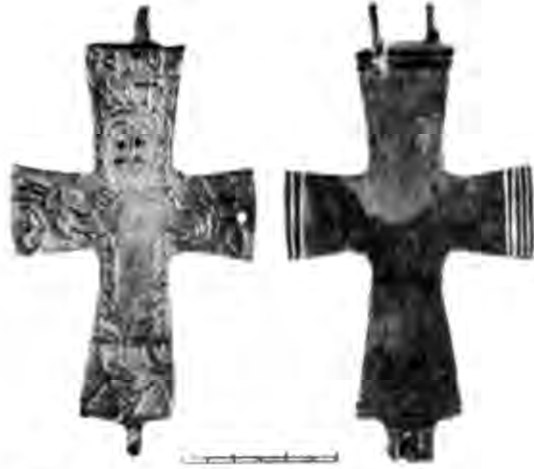
Рис. 3. Хрест-енколпійон св. Фотія. Ермітаж.