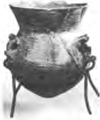
Рис. 14. Лампада з фігурними ручками. Ермітаж.

Прикладом такої пам'ятки є фрагмент блюда (рис. 13) із зображенням сельджуцького воїна з шаблею, знайдений на підлозі приміщення 3, будинку III. Найближчою стилістичною аналогією до зображення на цій посудині є малоазійська чаша XII ст. з Христофором-кінокефалом 57 . Кераміка цього типу відома у Константинополі і містах західного узбережжя Малої Азії: у Пергамі та Смирні 58 . Особливо значними були знахідки у Пергамі, що давало А. Міґу підстави вважати, що саме це місто, яке Мануїл I Комнін (1143—1180) зробив столицею прикордонної з сельджуками феми Неокастра 59 , у другій половині XII ст. стало великим центром по виробництву та експорту поливного посуду. Ця гіпотеза пояснює знахідки кераміки зграфіто як у Константинополі і різноманітних центрах узбережжя Егейського моря, так і в Херсонесі.