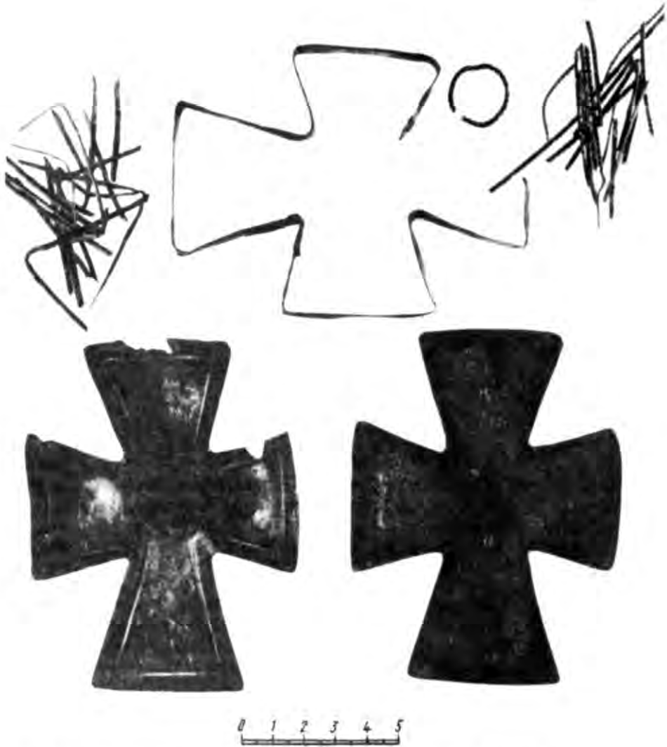
Рис. 4. Хрест-релікварій з орнаментом із накладних джугтиків. Ермітаж.

сельджуцька монета Кая Хусрува ібі-Кілідж Арслана (1204—1210 рр.) 17 , знайдена в шарі підлоги підвалу 1. Близька за часом випукло-ввігнута монета XII—XIII ст. трапилась на підлозі сторожки ("південне приміщення") 18 , а сельджуцька 1213—1214 рр. — в приміщенні 4 будинку I 19 . Ці знахідки узгоджуються з даними про будівництво в XIII ст. ряду садіб в сусідньому кварталі XIII—XIV, а також згаданій церкви (храм №21) 20 . В цьому плані цікава і думка Г. Д. Белова про порівняно пізню дату (XII—XIII ст.) спорудження цвинтарної каплиці 21 .