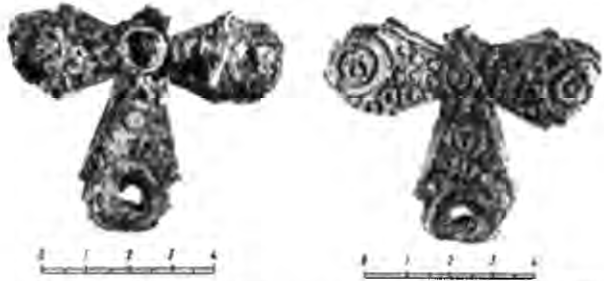
Рис. 5. Хрест з орнаментом із спіралей. Лицьова сторона. Ермітаж.