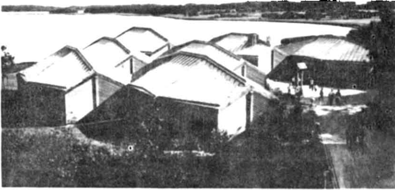
Рис. 2. Загальний вигляд музею вікінгів Хайтхабу.

1985 року відкрився філіал музею — музей вікінгів в Хайтхабу (рис. 2). А після цього, вже 1986 року, музей святкував своє 150-річчя і з цього приво-