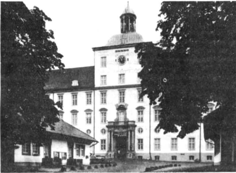
Рис. 1. Замок Готторф.

1835 року Датський Національний музей в Копенгагені передав із своїх фондів колекцію, що складалася з трьохсот археологічних експонатів, до міста Кіля, де вона уклала основу нового музею «вітчизняних старожитностей». У зв'язку із святкуванням 100-річного ювілею, у 1935 році, назву му-