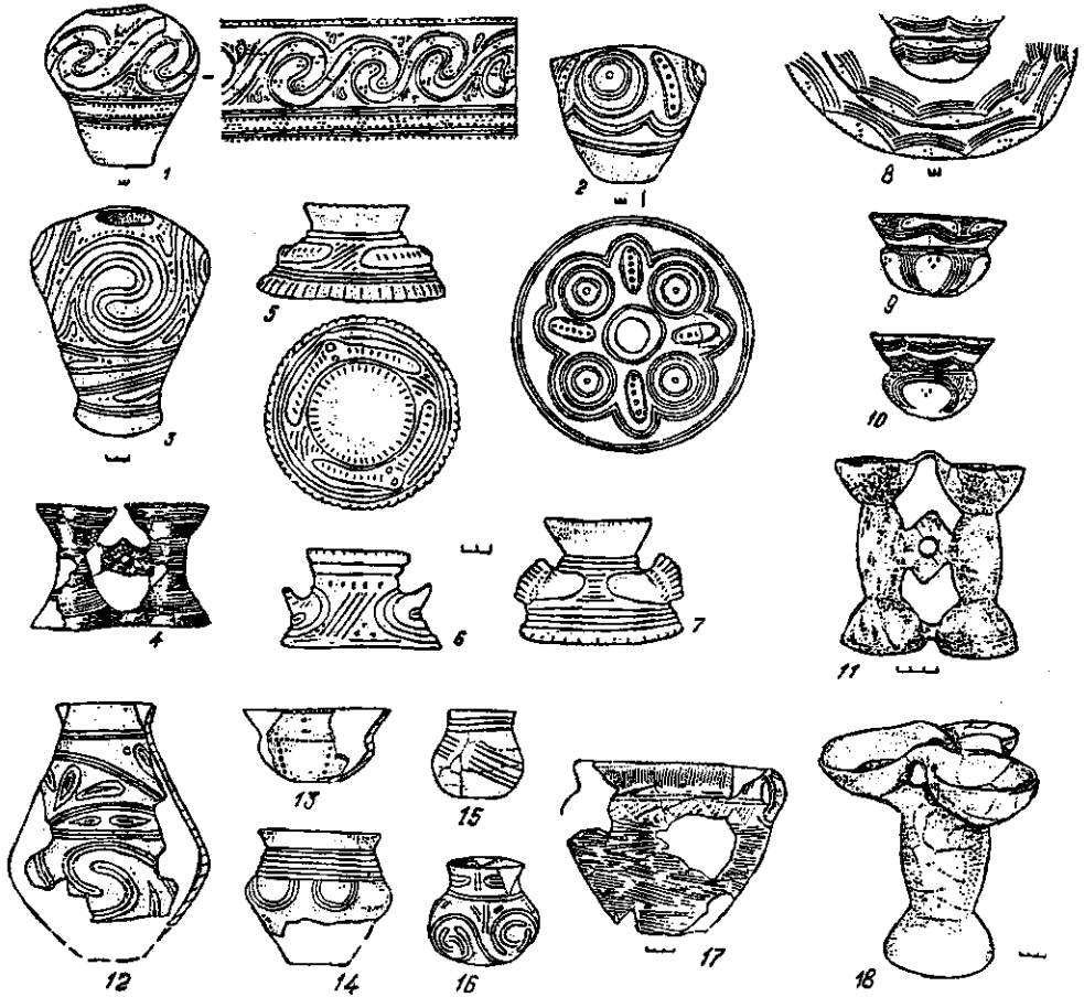
Рис. 2. Кераміка буго-дніпровського локального варіанту (Шкарівка, Миропілля, Веселий Кут): 1 — зерновик; 2—3 — грушоподібні вази; 4 — біноклеподібна посудина; 5—7 — покритки; 8—10 — кратери; 11 — біноклеподібна посудина; 12 — глек; 13 — кратер; 14 — широковідкритий горщик; 15, 16 — кубки; 17 — кухонний горщик; 18 — тринокль.

ки (рис. 2, 15, 16). Незважаючи на значну різноманітність типів, кераміка груп єдина за технологією виготовлення і, що особливо важливо, зберігає орнаментальну стильову спільність. Всі посудини прикрашені спіральньо-стрічковим жолобчастим орнаментом, для якого характерне ритмічно-зональне розміщення візерунка. У декорі переважає спіральна стрічка з кількох заглиблених ліній. Класичним для характеристики буго-дніпровського локального варіанту, як і для всієї східнотрипільської культури, слід вважати комплекс поселення біля Веселого Кута 9 . Саме в цей час зазначений стиль орнаментатії, характерний для кераміки східнотрипільської культури, повністю формується та витісняє більш ранні елементи.