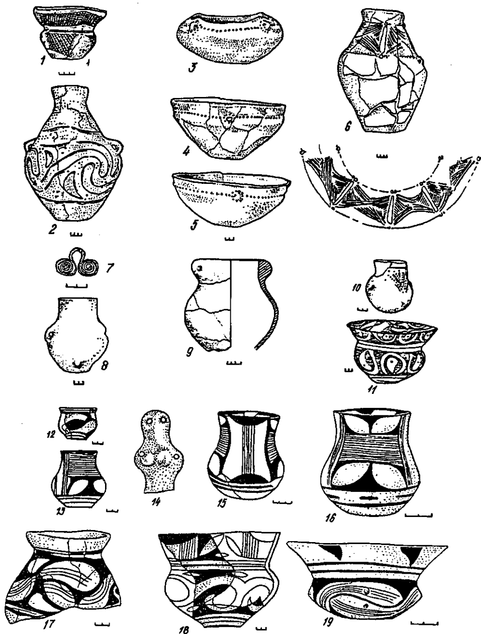
Рис. 4. Кераміка з інокультурними ознаками та імпортна (Веселий Кут, Гарбузин, Тростянички).

Волині. На Шкарівському поселенні трапляються кубки та шароподібні посудини, масивні глечики-амфори, пофарбовані білою фарбою або вохрою після випалу. Аналогії їм є в матеріалах могильника біля Звенигорода 15 та інших пам'ятках Західної Волині. Фрагмент тонкостінної чаші із Шкарівки, орнаментованої червоною фарбою ланцюжком заштрихованих трикутників, нагадує декор чаші з поселення поблизу с. Зимне 16 . Зв'язки лендельського та східнотрипільського населення, що намітились на ранньому етапі культури Лендель Волині (Зимне-Злото), тривають і далі (етап Вербковице-Костянець). На пам'ятках етапу Вербковице-Костянець поширюються широко відкриті з рельєфними виступами та профільовані миски із заглибленим ямковим орнаментом біля основи вінець 17 . Посуд подібної форми і орнаментатії, в якому відчувається місцеве