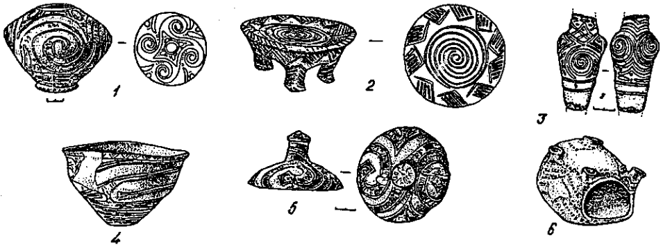
Рис. 3. Кераміка південнобузького локального варіанту (Березівка): 1 — грушоподібна посудина; 2 — вівтар; 3 — статуетка; 4 — миска; 5 — покришка; 6 — модель печі.

Лише у населення пам'яток типу Веселого Кута буго-дніпровського локального варіанту (Веселий Кут, Копіювата, Пеніжкове, Вільховець) існував ритуал закладки під майбутнє житло зооморфних пластичних зображень (ведмедя, кабана, риби тощо).