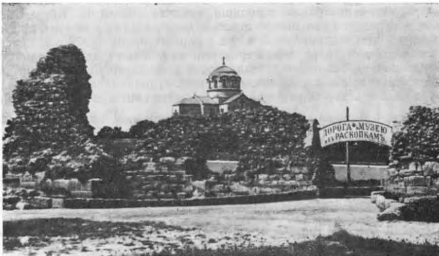
Рис. 2. В'їзд до Херсонеського музею. Дореволюційне фото.

Можливо, дещо перебільшуючи, голова Археологічної комісії О. О. Бобринський, розпочинаючи організацію систематичних розкопок, писав про період до 1886 р.: «Протягом майже ста років тут копав хто хотів, а щодо заходів по збереженню Херсонеса — влаштуван-