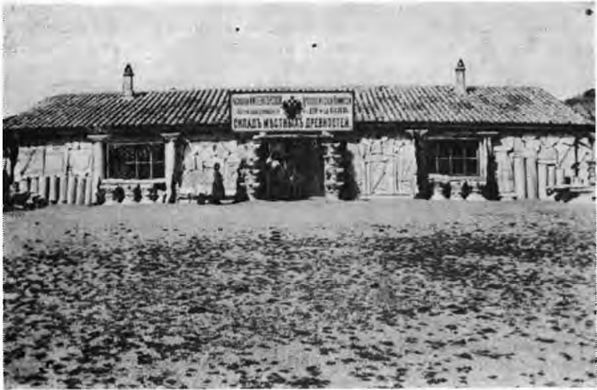
Рис. 5. Перша музейна експозиція на території музею.

та В. Г. Тізенгаузена: «Погляд кабінетного вченого, який ніколи не був у Херсонесі і прирівнює його до тих городищ, де дійсно немає чого влаштовувати музей. Розкопки у Херсонесі триватимуть ще ціле століття й неже всі старожитності будуть постійно перевозитися до Москви чи Петербурга? Я впевнений, що питання про місцевий музей — це тільки питання часу».