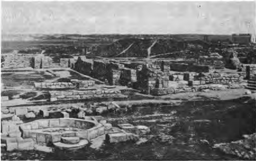
Рис. 4. Видляд «Уварівської базилики» після реставрації.

Але Косцюшко обстоював ідею створення справжнього музею, щоб вчені мали змогу вивчати старожитності Херсонесу на місці, одночасно з відкритими руїнами. В одній з праць Косцюшко пише: «На вивчення археології та історії Херсонеса звернуто серйозну увагу, проте маса зібраного на розкопках матеріалу лишається нерозібраною і не розподіленою між вченими, що особливо стосується церковних старожитностей... Зростає також інтерес до розкопок поміж особами, які щорічно відвідують південний берег Криму. Так, у книзі для відвідувачів, що є в музеї, розписалося 1900 р. 5128 осіб. Якщо мати на увазі, що половина відвідувачів не розписується у книзі, то наведена цифра досить значна і свідчить про необхідність створення у Херсонесі впорядкованого музею» 22 .