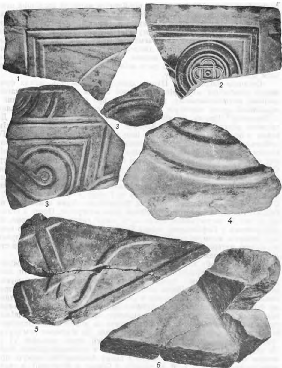
Рис. 1. Фрагменти різьбленого мармуру з розкопок Десятинної церкви у Києві: 1, 2 — фрагмент плити вітварної огорожі з розкопок Д. В. Мілєєва 1908 р.; 3, 4 — фрагменти різьбленого плити з розкопок М. К. Каргера 1939 р.; 5, 6 — фрагмент фронтальної частини віка мармурового саркофага (яма № 6, розкопки М. К. Каргера). Лівий бік, зовні й зсередини.

ного використання 14 . Проте на другому боці фрагмента (рис. 1, 2) бачимо композицію іншого типу. Тут збереглося більше половини рельєфного кола меншого діаметру, створеного широкою випуклою стрічкою, що має по краях вузькі кромки з глибоким рельєфом. У нього вписана чотирипелюсткова розетка з квадратом та маленьким колом усередині. Коло щільно примикає до рамки, яка обмежує композицію. З боку зламу рельєф читається гірше, але досить, щоб побачити тут зображення лаврового вінка, в який звичайно вміщували хрест або монограму Христа — хризму. Тобто, можна припустити, що з цього боку плита мала симетричну композицію, головна схема якої повторює типи, що широко репрезентовані у візантійському мистецтві. По-