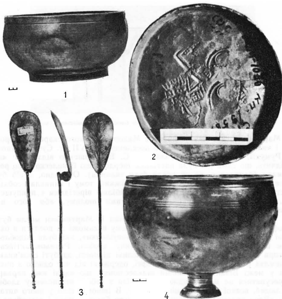
Рис. 1. Візантійські речі із Мартинівського скарбу: 1 — чаша, 2 — клеймо на дні чаші, 3 — ложечка, 4 — кубок.

чином, археологічними даними підтверджується спільне проживання антів і склавів на Нижньому Дунаї.