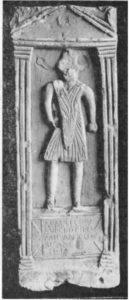
Рис. 1. Надгробок вільновідпущеників (фото).