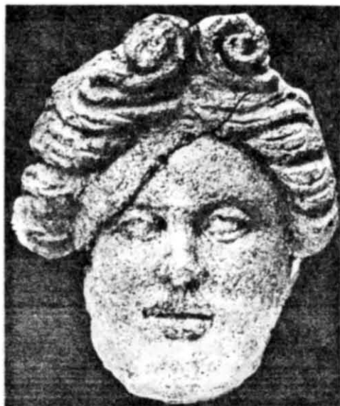
Рис. 2. Голова Аполлона-кифареда (терракота).

Подобная прическа известна уже в классическую эпоху — именно так убраны волосы Аполлона (бронзовая голова V в. до н. э. с острова Кипр, хранящаяся в Британском музее) 13 . В несколько усложненном виде эта прическа известна в эллинистическую эпоху. Судя по скульптурным памятникам, она чаще всего встречается у Аполлона 14 : у Аполлона из собрания графа С. Строганова 15 , у Аполлона из Британского музея 16 и, наконец, у Аполлона Бельведерского (Ватиканский музей). Таким образом, наличие аналогий не противоречит определению терракоты как изображения именно этого божества. Косвенным подтверждением этого может служить и место находки — территория античного театра, вблизи которого, согласно Витрувию, обычно выделяли участок и для храма Аполлону 17 . О его близости к театру может свидетельствовать и одна из его эпиклез (Мусагет).