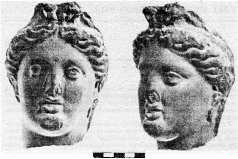
Рис. 1. Голова Аполлона (терракота).

ностью сохранившаяся голова с частью шеи*, состоящая из двух частей — лицевой и затылочной (рис. 1). Соединительный шов обработан небрежно (заглажен с левой стороны и оставлен «острым» с правой). Терракота была внутри полая. Обратная сторона с округло-продольным отверстием, слегка сужающимся к шее, заглажена. В волосах и возле глаз изображенного — следы белого ангоба. После оттиска терракота дополнительной обработкой не подвергалась — этим можно объяснить нечеткую форму верхней губы и «смазанность» нижней части ушей. Нос оказался «подчеркнут» бесформенной трещиной, испортившей верхнюю губу. По нашему мнению, голова принадлежала терракотовой статуэтке высотой не менее 70 см, выполненной из херсонесской глины. Для определения ее высоты мы воспользовались общепринятым в эллинистическую эпоху «каноном» Лисиппа, считавшего, что голова человека составляет 1/7 часть фигуры 10 . Терракота такой высоты не исключение для Херсонеса, где имеется целая группа фрагментированных статуэток из глины, выделяющаяся не только размерами, но и приемами лепки. Впервые эту группу выделил Г. Д. Белов как «чисто местное направление», существовавшее в херсонесской коропластике в III—II вв. до н. э. 11 . Добавим, что терракоты этой группы — культовые. В эллинистическую эпоху помимо Херсонеса они производились в некоторых малоазийских мастерских, а в Северном Причерноморье фрагменты таких терракот встречены в Пантикапее, Танаисе, Ольвии 12 .